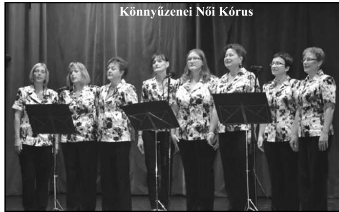
Könyűzenei Női Kórus

Szeressük egymást gyerekek, hisz minden percért kár!” Az idén helyi fellépők műsora szórakoztatta a jelen