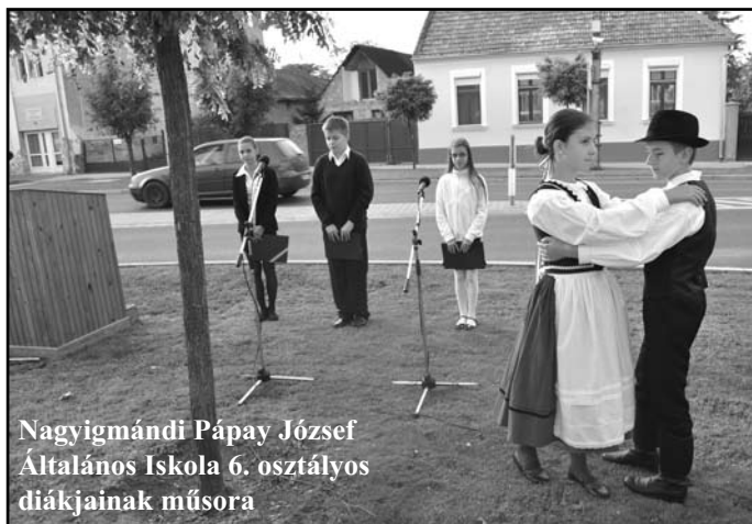
Nagyigmándi Pápay József Általános Iskola 6. osztályos diákjainak műsora