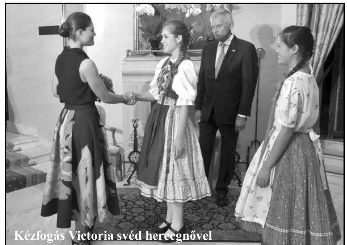
Kézfogás Viktória svéd hercegnővel

vel. A hercegnő megdicsérte Rábaközi gyermekviselőtet, amit a nagyigmándi Árgyélus néptáncgyűttestől kaptam kölcsön erre az alkalomra. Ezúton is szeretném ezt megköszönni. Az estély után mosolygós-pityergős búcsúzás következett, hiszen másnap el kellett válnunk újonnan szerzett barátainktól.