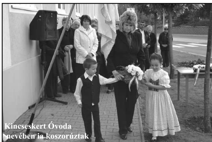
Kincseskert Óvoda nevében is koszorúztak