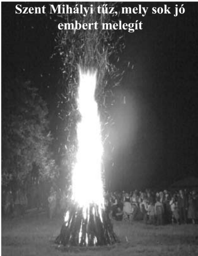
Szent Mihályi tűz, mely sok jó embert melegít

tanulónk, valamint egy felnőtt tagunk is részt vehetett a Budapesti Minősítő Fesztiválon, s a zsűri minősítette is a Tata Néptáncgyűttest. Másik felnőtt tagunk a budapesti Bem Táncgyűttestel vett részt a minősítőn kiváló eredményt elérve. Szeptember elején az