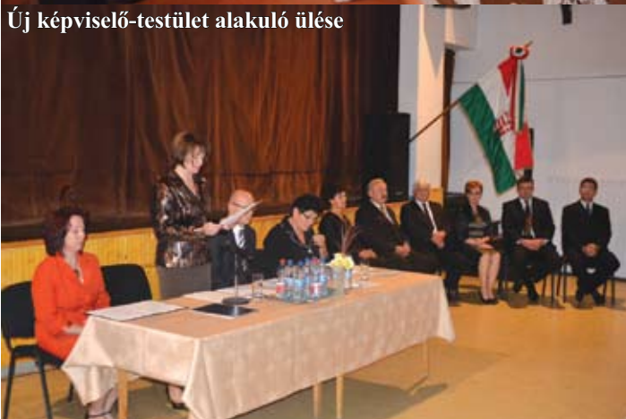
Új képviselő-testület alakuló ülése