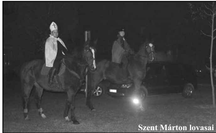
Szent Márton lovasai

ján minél több emberhez próbáltak eljuttatni a megemlékezők és ettől az időtől szabadott a régiségben gyertyát gyűjtani a műhelyekben. A kellemes séta során sokan jöttek ki a házak elé csodálattal nézve a világító menetet. Az óvoda udvarára visszatérve, forró tea, az