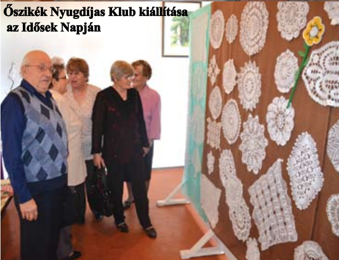
Őszi Nyugdíjas Klub kiállítása az Idősek Napján