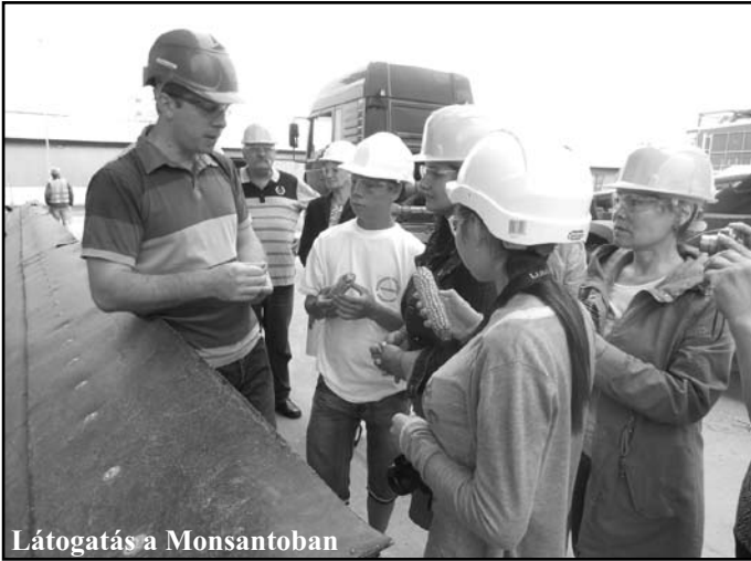
Látogatás a Monsantoban