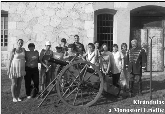
Kirándulás a Monostori Erődbe