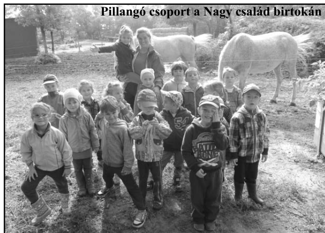
Pillangó csoport a Nagy család birtokán