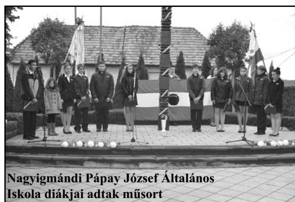
Nagyigmándi Pápay József Általános Iskola diákjai adtak műsort

hoz, hogy a szovjet óriás egyet visszalépjén, és engedjen a követeléseknek. Ezzel kezdetét vette egy rövid, de