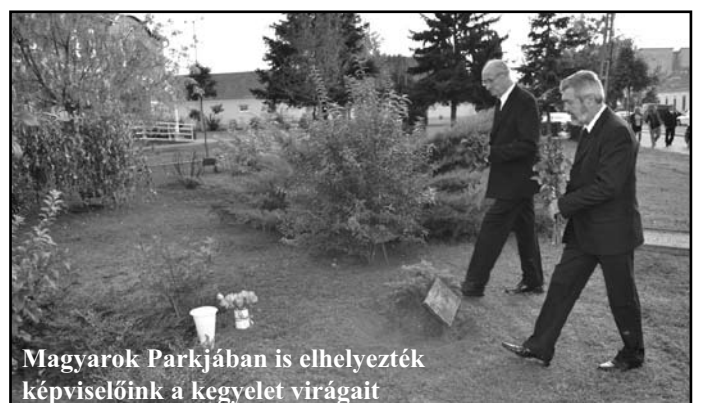
Magyarok Parkjában is elhelyezték a kegyelet virágait