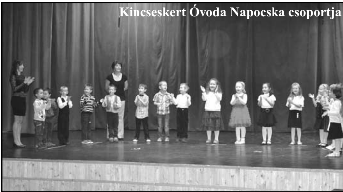
Kincseskert Óvoda Napocska csoportja