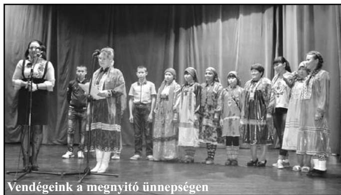
Vendégeink a megnyitó ünnepségen

érdekes egyéniséggel, vagy éppen elleshették a sajtékészítés, rétes sütés, káposztás vakarcs készítés vagy az atlétikai dobószámok, fafaragás, íjászat fortélyait. Ezúttal sem maradt el a találkozó a kézimunka szakkörös asszonyokkal. Emlékezetes marad a Monostori erődbe tett ágyúszótól hangos délután, a Monsanto Hungária Kft. üzemében tett látogatás, a hagyományörzőkkel töltött délelőtt, a táncházak is. Vendégeink biztosan soha nem felejtik el az ének