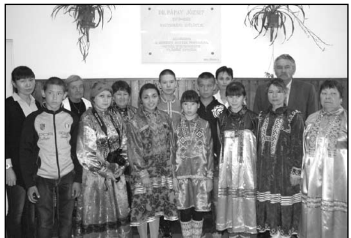
Csoportkép a tanévnyitó után