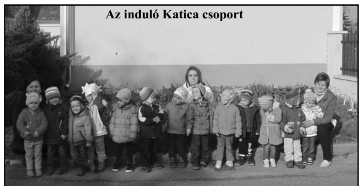
Az induló Katica csoport