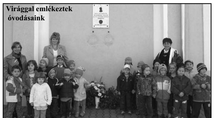
Virággal emlékeztek óvodásaink