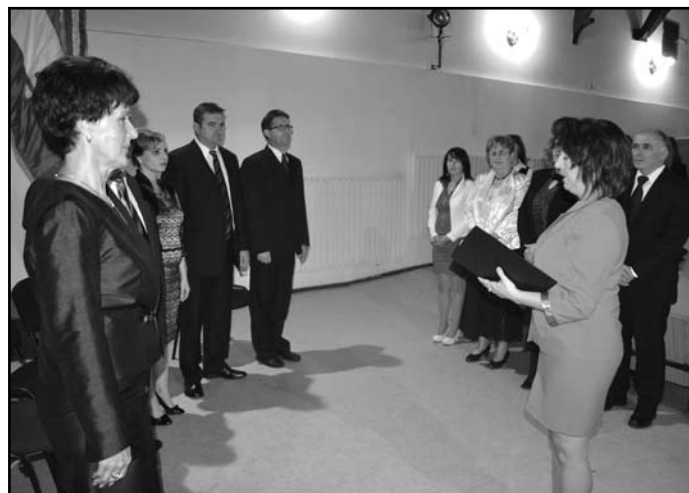
Az új képviselők