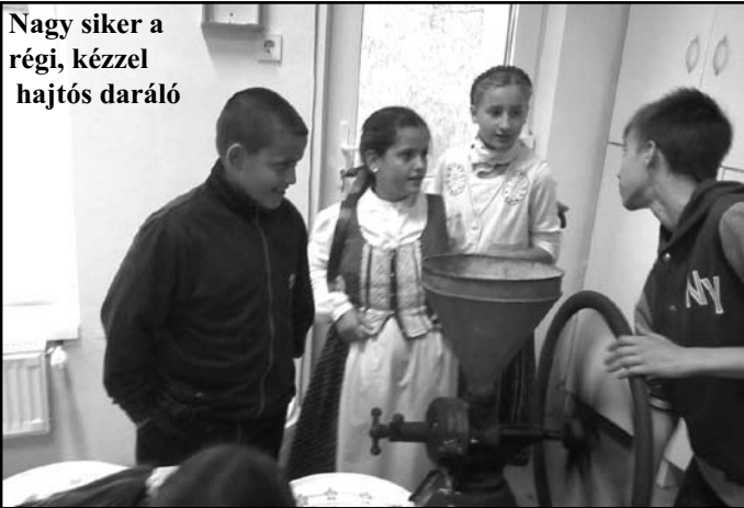
Nagy siker a régi, kézzel hajtós daráló