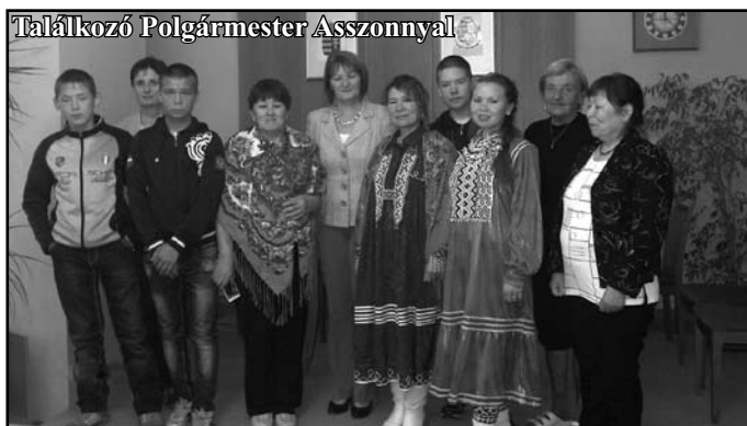
Találkozó Polgármester Asszonnyal