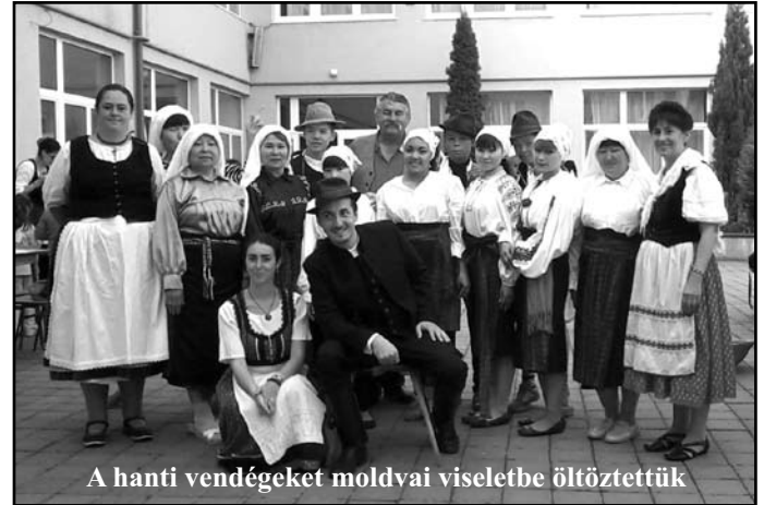
A hanti vendégeket moldvai viseletbe öltöztettük