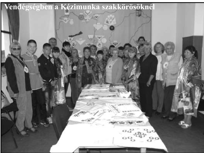
Vendégségben a Kézimunka szakkörösöknél