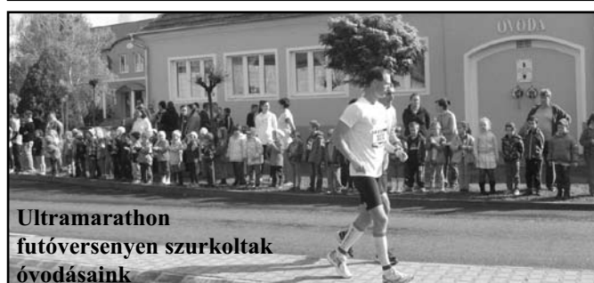
Ultramarathon futóversenyen szurkoltak óvodásaink