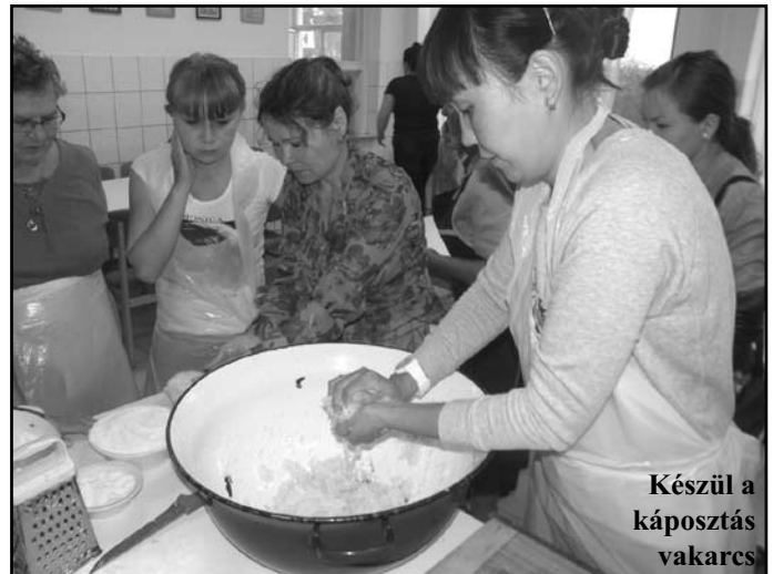
Készül a káposztás vakarcs