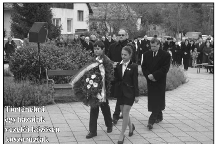
Történelmi egyházaink vezetői közösen koszorúztak