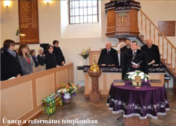
Ünnep a református templomban