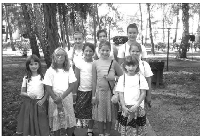
Néptáncos lányok a fonyódligeti Erzsébet táborban