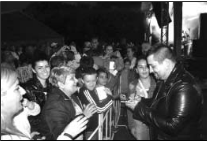
Caramel és a rajongói