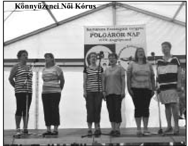
Könyvzenei Női Kórus