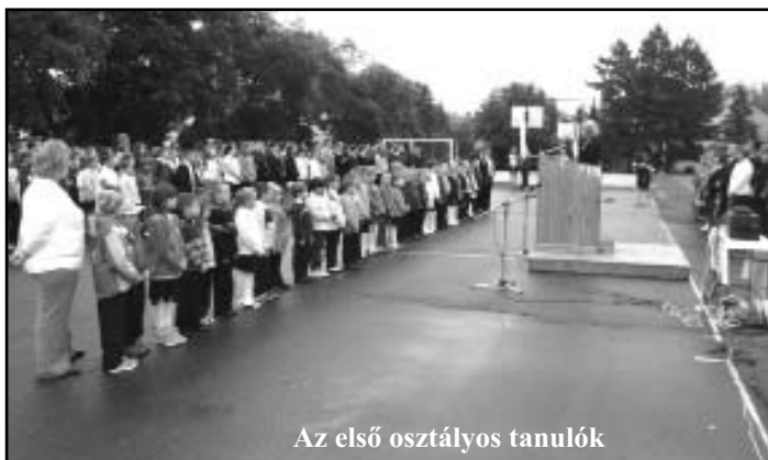
Az első osztályos tanulók