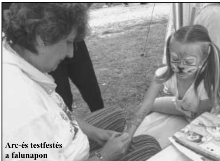
Arc-és testfestés a falunapon