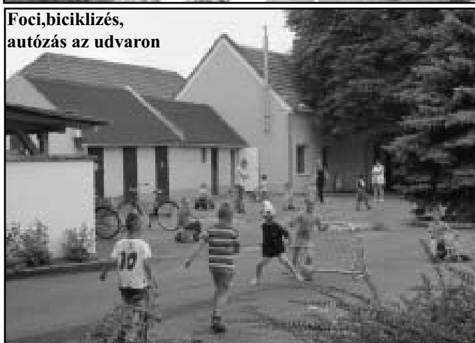
Foci, biciklizés, autózás az udvaron