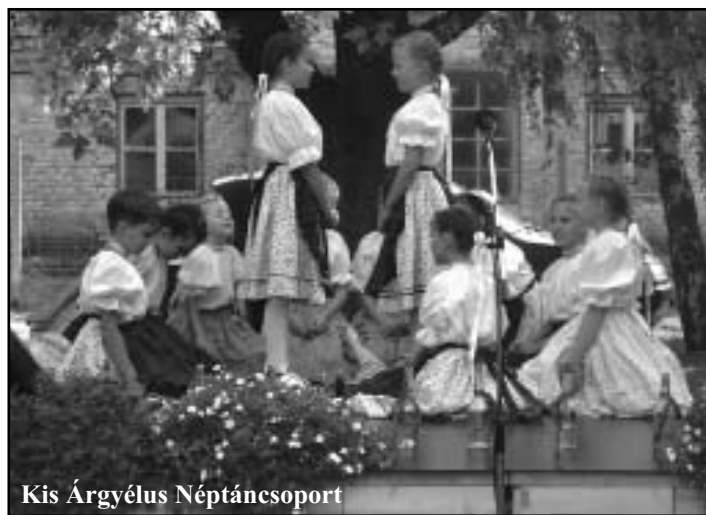
Kis Árgyélus Néptáncsoport