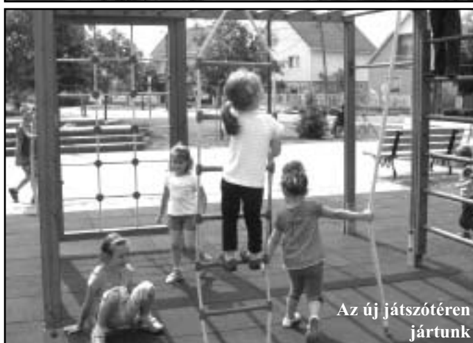
Az új játszótéren jártunk