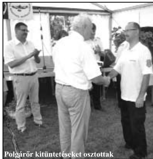
Polgárőr kitüntéseket osztottak

Nagymánd Község Polgárőrsége polgárőr érdemkereszt arany fokozatát és 100.000.-Ft pénzügyi támogatást kapott.