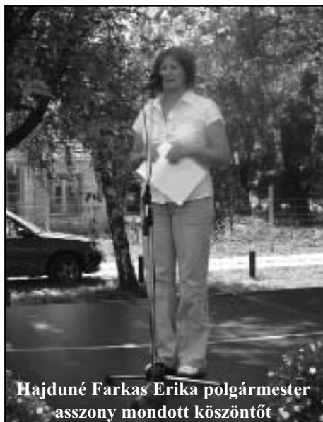
Hajduné Farkas Erika polgármester asszony mondott köszöntőt

Parkban összegyűltek. Ezután elkezdődtek az ügyességi és sportprogramok kicsiknek és nagyoknak, a szellemi megmérettetésre vágyóknak pedig a szokásos Pusztatót nyújtott egy kis fejtörőt. A légvár pedig a felhőtlen jókedvet biztosította a kicsiknek