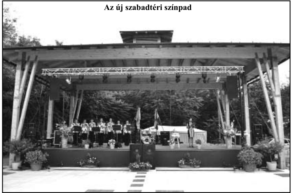
Az új szabadtéri színpad

Az építési engedélyezési tervek elkészítését követő engedélyezési eljárás időtartama alatt elkészítettük a kiviteli terveket és előkészítettük a kivitelezési fázist azzal, hogy pályázatot írtunk ki a létesítmény teljes körű megvalósítására.