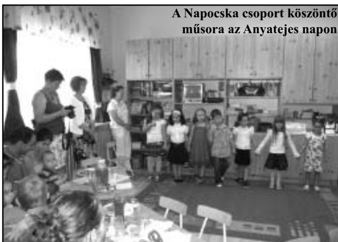
A Napocska csoport köszöntő műsora az Anyatejes napon