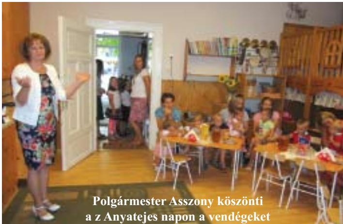
Polgármester Asszony köszönti a z Anyatejes napon a vendégeket