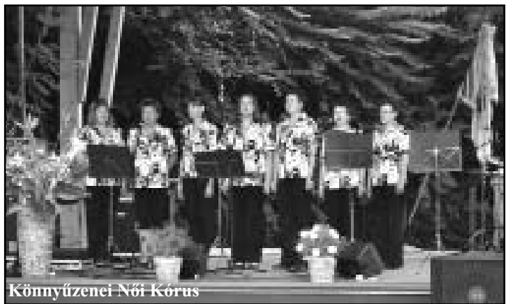
Könnyűzenei Női Kórus