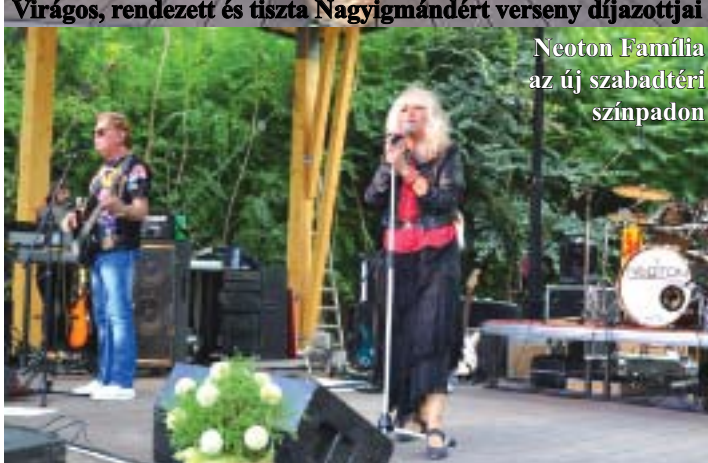
Neoton Famíliá az új szabadtéri színpadon