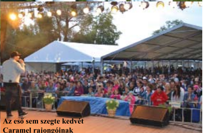
Az eső sem szegte kedvét Caramel rajongóinak