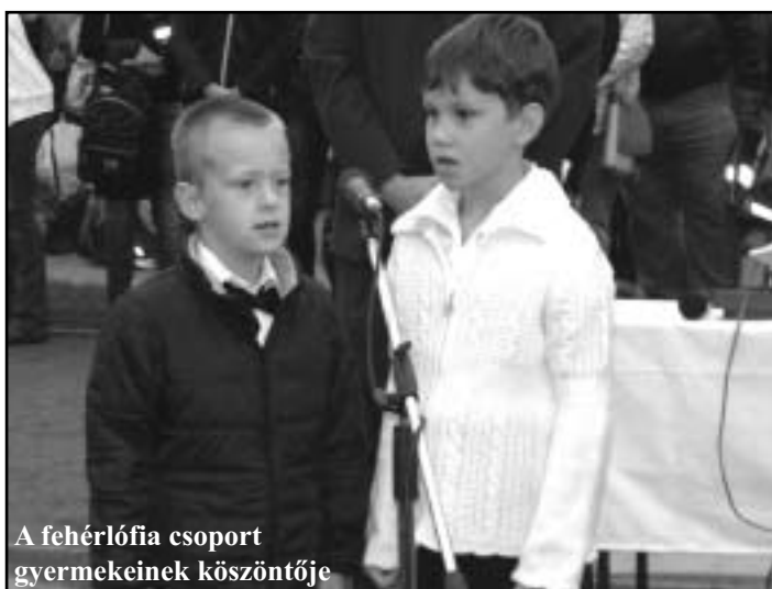
A fehérlófia csoport gyermekének köszöntője