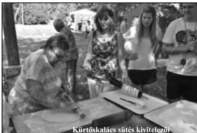
Kürtőskalács sütés kivitelezői