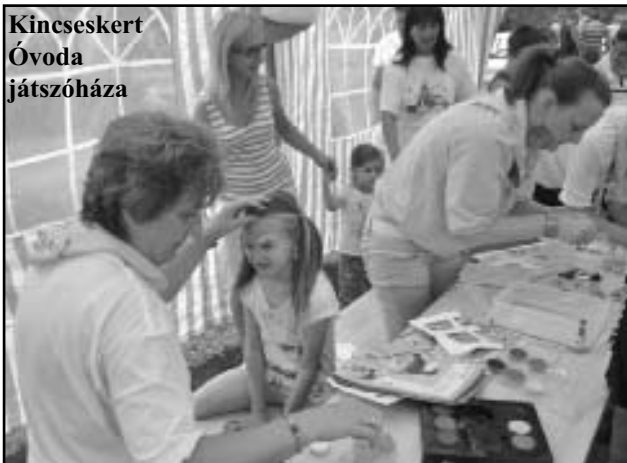
Kincseskert Óvoda játszóháza