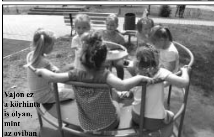
Vajon ez a körhinta is olyan, mint az oviban