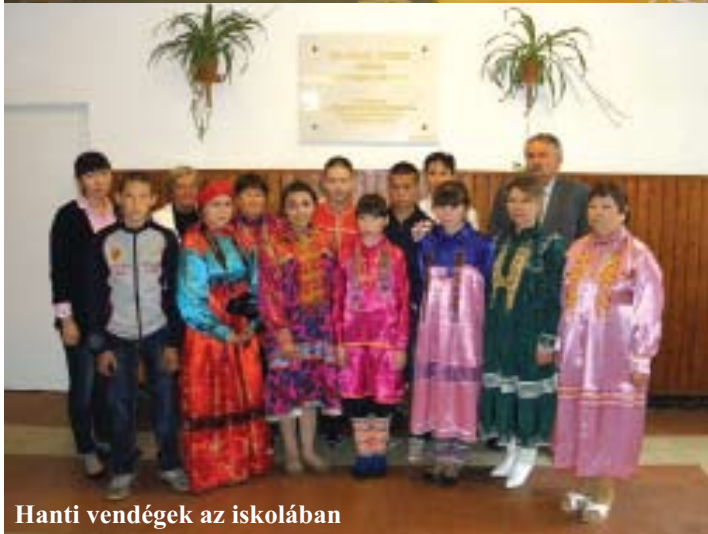
Hanti vendégek az iskolában