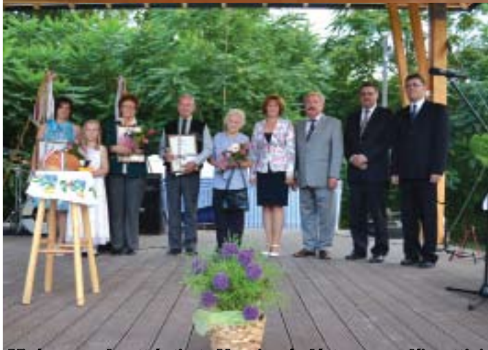
Virágos, rendezett és tiszta Nagyigmándért verseny díjazottjai