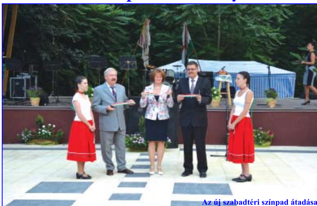
Az új szabadtéri színpad átadása

Nemzeti ünnepünkhöz kapcsolódva augusztus 19-én, kedden este gyűltek össze településünk lakói Szent István Királyunkat, az Új Kenyeret valamint az új szabadtéri színpad átadását ünnepelni.