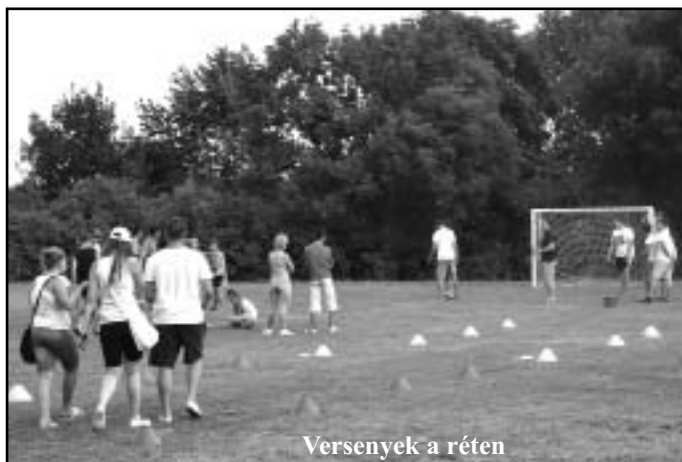
Versenyek a réten