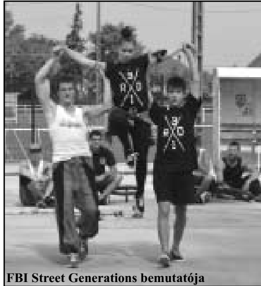
FBI Street Generations bemutatója