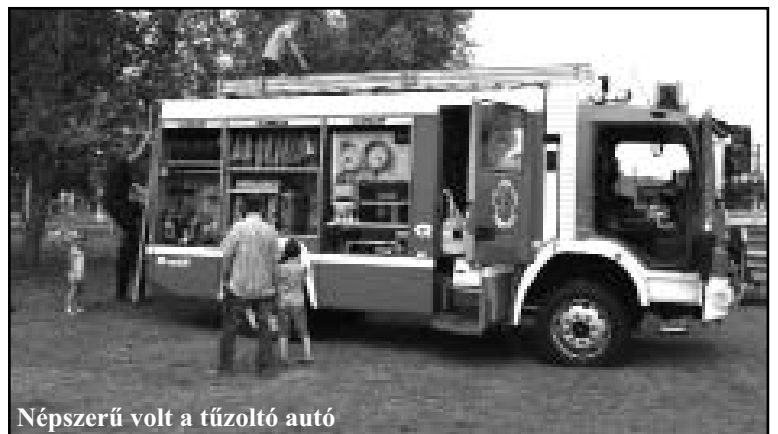
Népszerű volt a tűzoltó autó

A hozzávalókat nem túl lágy tésztává gyúrjuk, kelesztjük majd sütőformára tekerve ízlés szerint cukorba, darált dióba forgatás után párázson megsütjük.