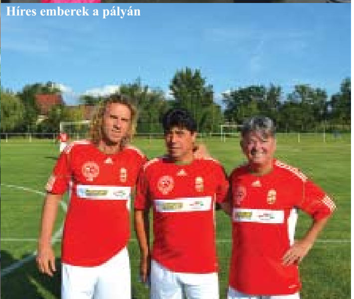
Híres emberek a pályán