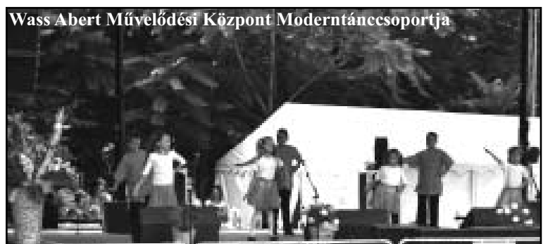
Wass Albert Művelődési Központ Modern táncsoportja