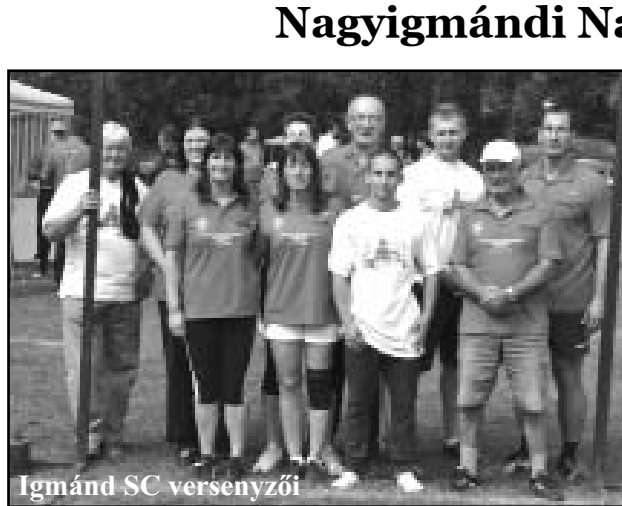
Igmánd SC versenyzői