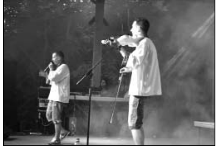
Matyi és a Hegedűs