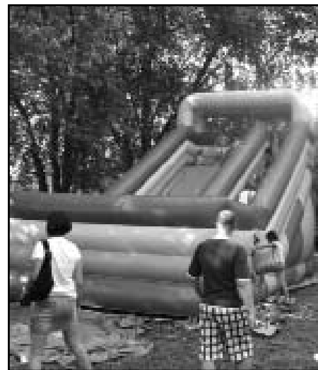
Légvár várta a kicsiket

Idei alkalommal is a gyerekek ügyességi versenyek mellett, kispályás fociban, a hétméteres rúgó