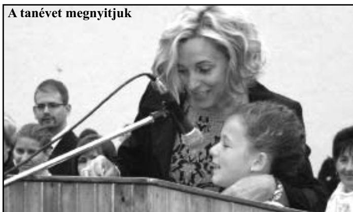
A tanévet megnyitjuk