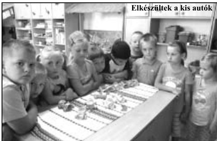
Elkészültek a kis autók