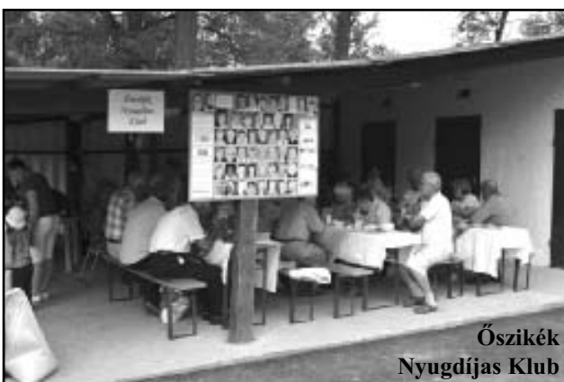
Őszikék Nyugdíjas Klub