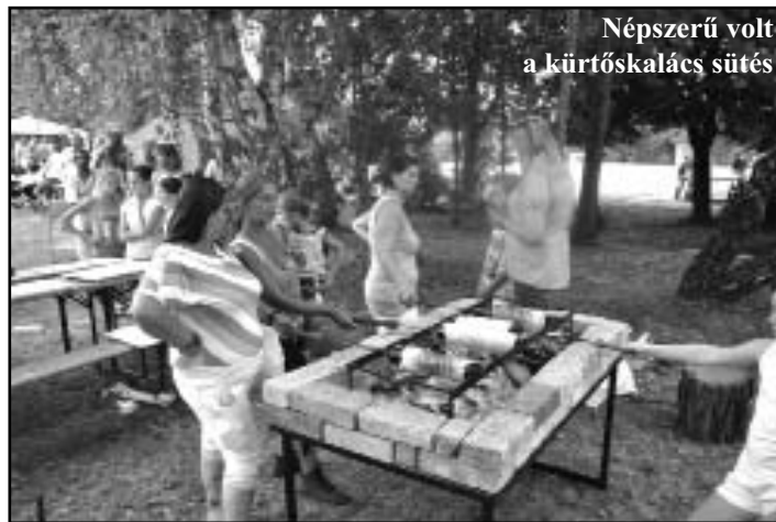
Népszerű volt a kürtőskalács sütés