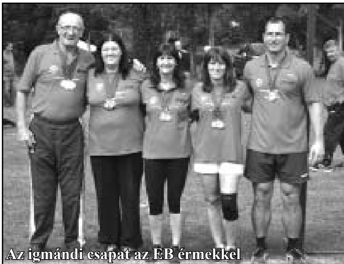
Az igmándi csapat az EB érmeikkel

A hétvégén Németországban rendezték meg a VII. LSW-WTC Speciális Dobószámok Európa-bajnokságát. A Szász-Anhalt tartományban található 85.000 fős Halberstadt gyönyörű sportlétesítményében zajlottak a versenyszámok. A szeszélyes időjárásban kánikulai meleg és a zivatarok váltogatták egymást. Sajnos a szervezők nem álltak a helyzetük magaslatán, a rendkívül sok időpont módosítás és csúszás is nehezítette a versenyzők formában maradását. A kevés versenybíró és sportszerek lassították a versenyszámok gördülékeny lebonyolítását. Mintegy 100 kg sportszert Magyarországról kellett vinni a szervezők kérésére. Volt olyan versenyszám, ami a hiányosságok miatt elmaradt. Az átszervezett programok és a fenti hiányosságok ellenére a korábbi sportbarátságok tovább mélyültek és újabb belépő versenyzőkkel alakultak ki jó kapcsolatok. A házigazda németek mellett angol, francia, ír, lengyel, litván, magyar, orosz,