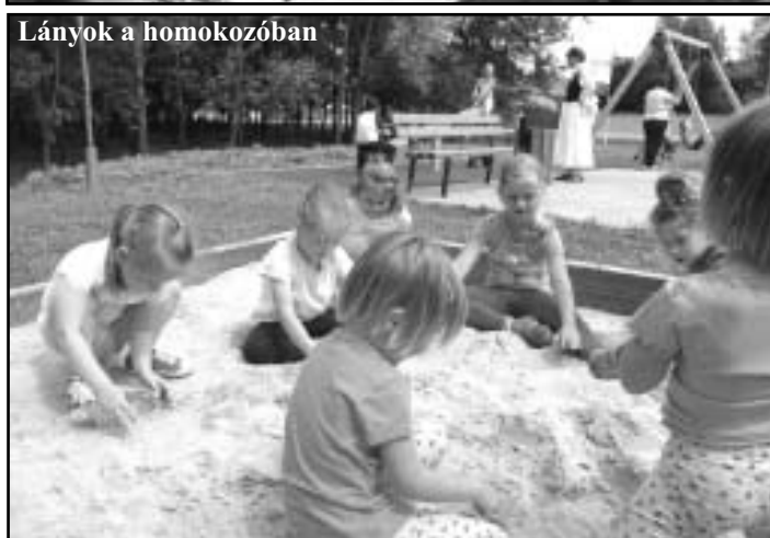
Lányok a homokozóban