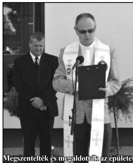
Megszentelték és megáldották az épületet