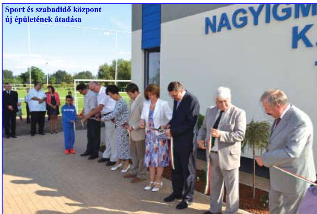
Sport és szabadidő központ új épületének átadása