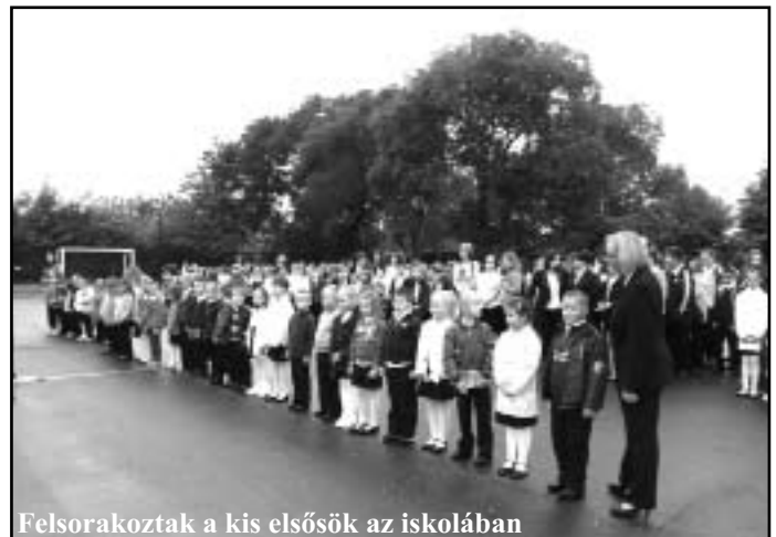
Felsorakoztak a kis elsősök az iskolában