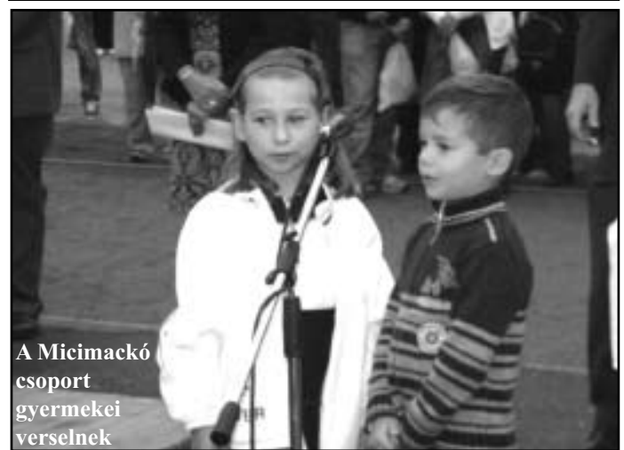
A Micimackó csoport gyermekei verselnek