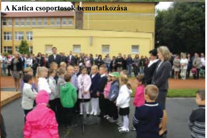
A Katica csoportosok bemutatkozása