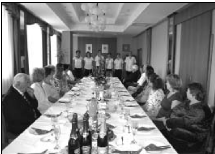
A Könnyűzenei Női Kórus előadása

Településünkön július 8-án a Nagyigmándi Közös Önkormányzati Hivatal dísztermében Hajduné