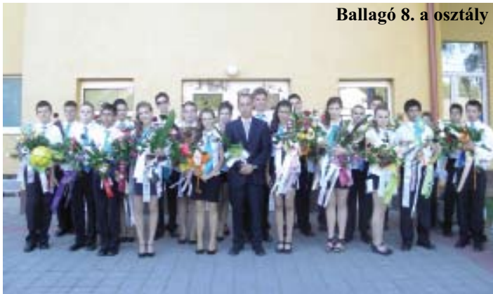
Ballagó 8. a osztály Ballagó 8. b osztály