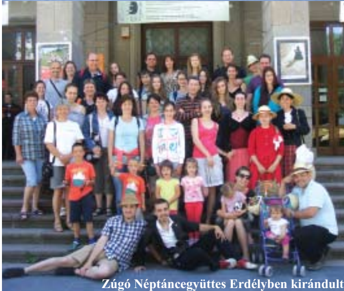
Zúgó Néptáncgyűjtés Erdélyben kirándult