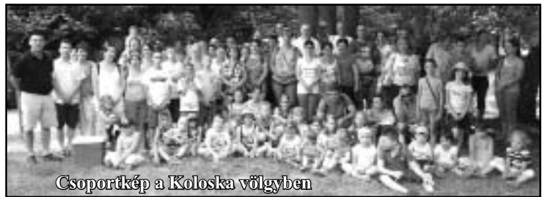
Csoportkép a Koloska völgyben