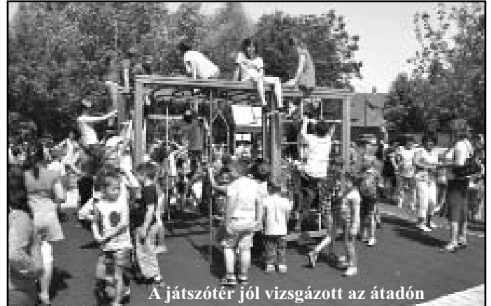
A játszótér jól vizsgázott az átadón