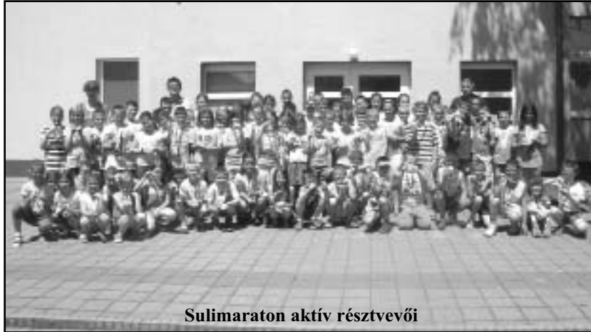
Sulimaraton aktív résztvevői

Mind a tizenegy alkalommal a legeredményesebb futókat tárgyjutalmak-