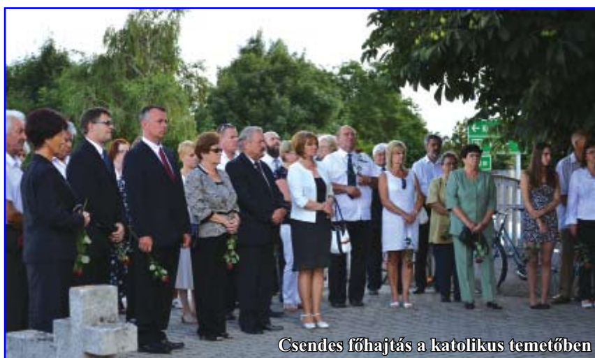
Csendes főhajítás a katolikus temetőben