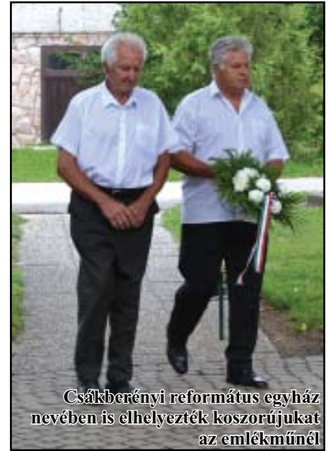
Csákberényi református egyház nevében is elhelyezték koszorújukat az emlékműnél