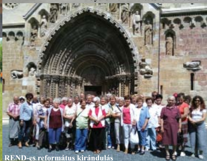
REND-es református kirándulás