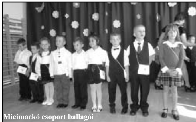
Micimackó csoport ballagói

ból és versekből összeállított műsorral kedvestek a gyerekek az anyukáknak és nagymamáknak, majd örömmel adták át kis cserepes virágaikat.