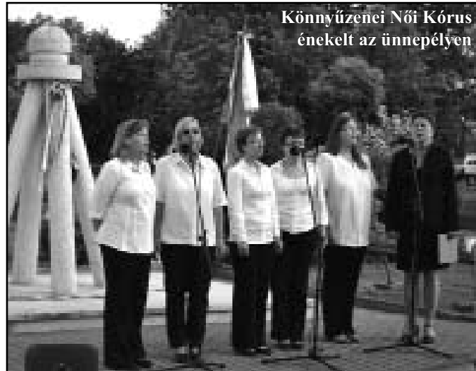
Könyvzenei Női Kórus énekelt az ünnepélyen