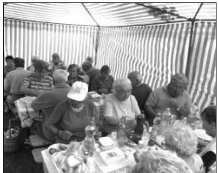
Zsiroskenyér parti az Ördöghegyen