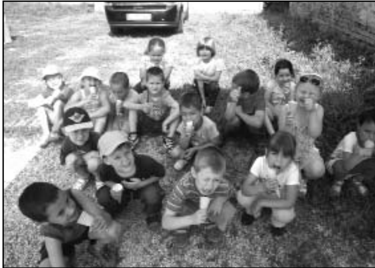
Napocska csop. év végi fagyizás

Műsorunk végén az édesanyáknak virággal kedveskedtek a gyermekek és a nagymamáknak pedig saját készítésű, személyes ajándékokat adtak át. Ezt követően az évzáró nemcsak ünnepélyes lezárása egy nevelési évnek, hanem egyben számvetés is. A gyerekek számot adnak tudásukról, egész évi munkájukról. A Napocska csoportot mindenki saját kis egyéniségével színesíti, ezért az évzáró műsorunkat nem rendhagyó módon versekkel, körjátékokkal zártuk, hanem mozgásban,