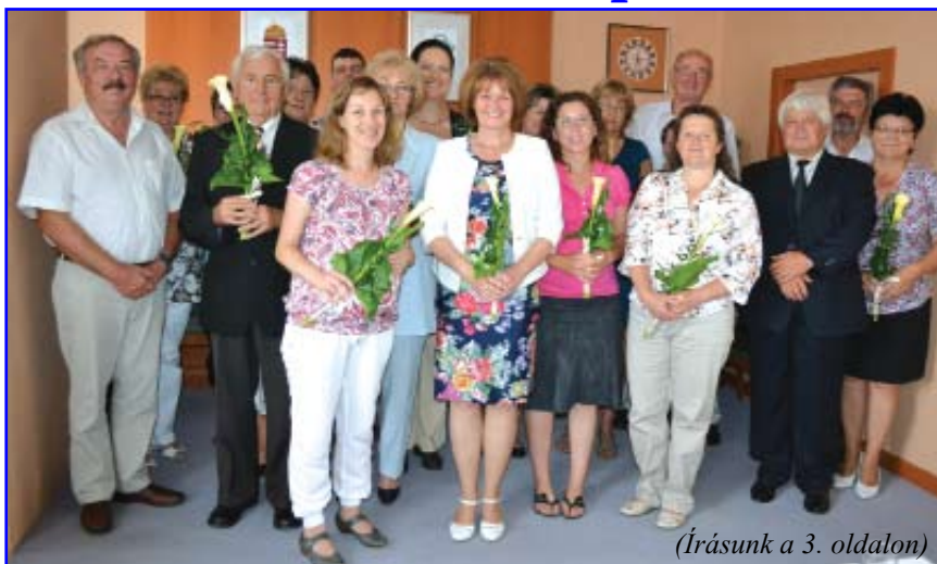
(Írásunk a 3. oldalon)