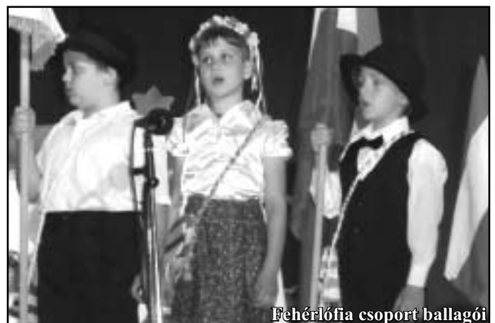
Fehérlófia csoport ballagói