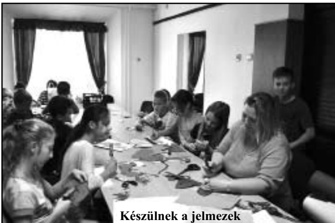
Készülnek a jelmezek