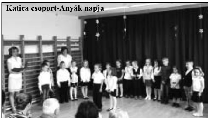
Katica csoport-Anyák napja