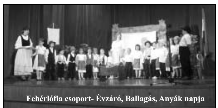
Fehérlófia csoport- Évszázó, Ballagás, Anyák napja