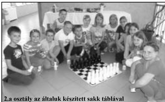
2.a osztály az általuk készített sakk táblával