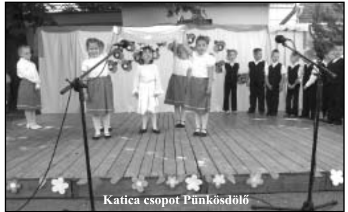
Katica csoport Pünkösdölő