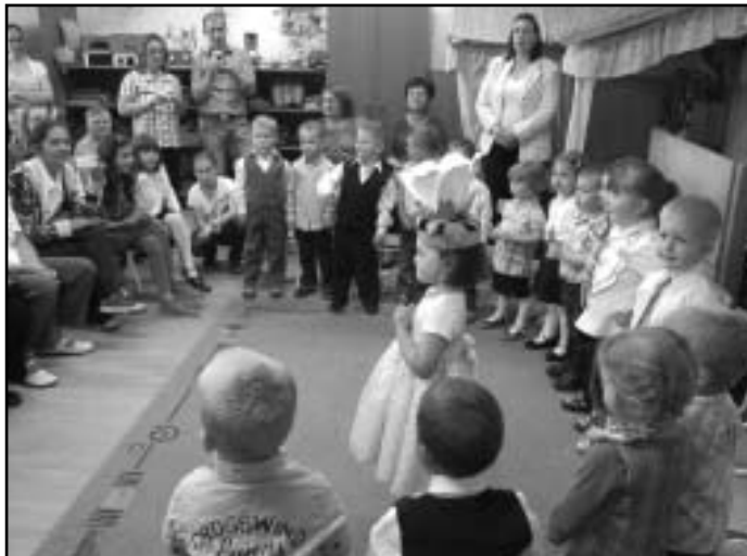
Süni csoport-Évzáró, Anyák napja

hosszasan készülődtek erre a napra. Kis csöppségek, hogy örömet szerezzenek anyukájuknak, meglepetést készítettek. Szívecskéket apró virágokkal díszítették, majd rákerült kis kéznyomatuk is. Május 9-én lelkes énekszóval, virágos ág alatt bújva kezdték meg műsorukat. A tanult mondókákból, versekből, dalos játékokból összeállított füzérrel lepték meg a közönséget. Az édesanyák könnyektől csillogó szemekkel kísérték figyelemmel gyermekeik szereplését. Nagyon ügyesek és fegyelmezettek