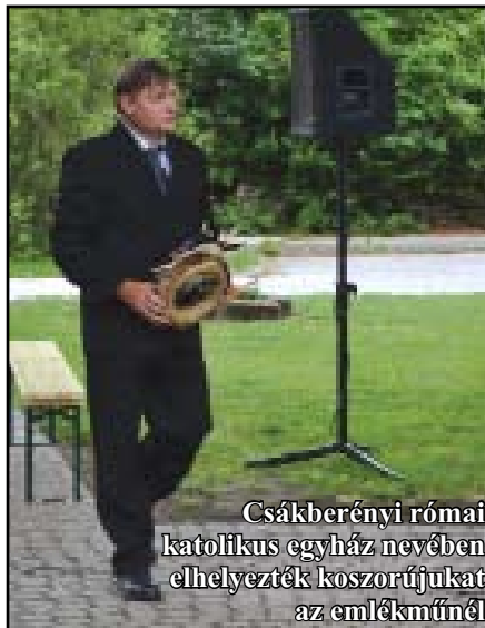
Csákberényi római katolikus egyház nevében elhelyezték koszorújukat az emlékműnél