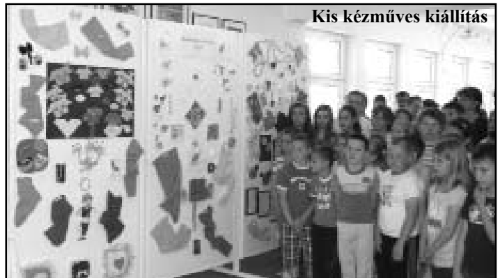
Kis kézműves kiállítás

tagozatos fiúk szépen kidolgozott famunkái – autó-, mozdonymodell, doboz-, tolltartó, az özszevonat II. csoport papírképei, tárgyai voltak láthatóak. A felsős lányok órai munkái: 5. osztályban a közszé- ben működő Kézimunka szakkör tagjaival együtt hímzett kis terítők, a hatodik osztályos keresztszemes hímzések, a hetedik horgolások, hővédő kesztyűk, s a nyolcadikos kötetek kerültek még kiállításra.