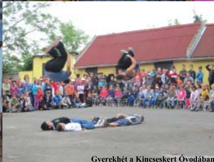
Gyerekhét a Kincseskert Óvodában