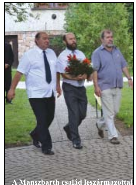
A Manszbarth család leszármazottai