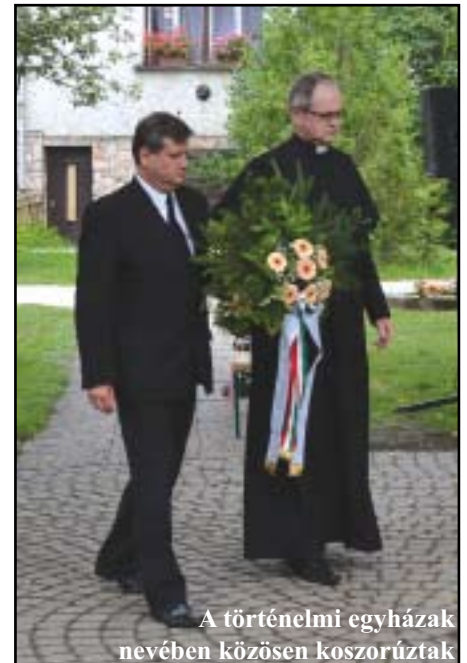
A történelmi egyházak nevében közösen koszorúztak