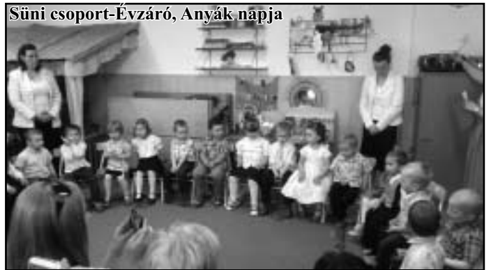
Süni csoport-Évzáró, Anyák napja

voltak óvodánk legkisebbjei az első Anyák napi műsorunkon. Pillangó csoportosok május 23-án tartották Anyák napi és évzáró