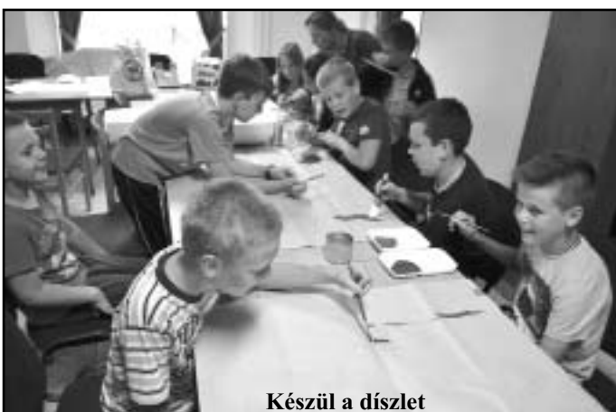
Készül a díszlet