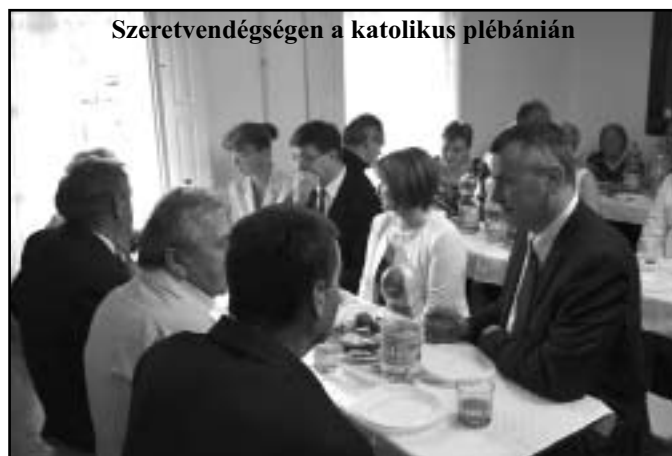
Szeretvendégségen a katolikus plébánián