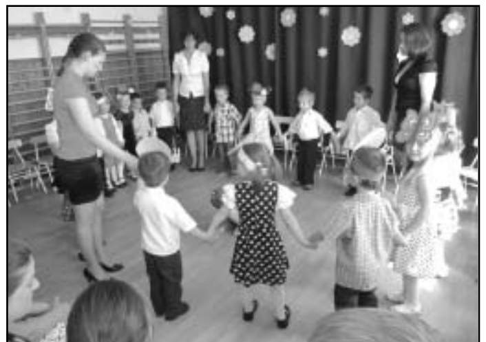
Pillangó csoport-Évzáró, Anyák napja

műsorukat. Virágokkal feldíszített tornaterembe várták a vendégeket. Régóta nagy volt a készülődés az ünnepi alkalomra. Műsorukban tavaszi mesét dolgoztak fel, a gyermekek életkorának és képességeinek megfelelően. Olyan versekkel, mondókákkal, dalos játékokkal tarkították a történetet, melyek a tavasz témaköréből a gyermekek kedvencei lettek. Talán ennek köszönhető, hogy boldogan és izgatottan választották ki,