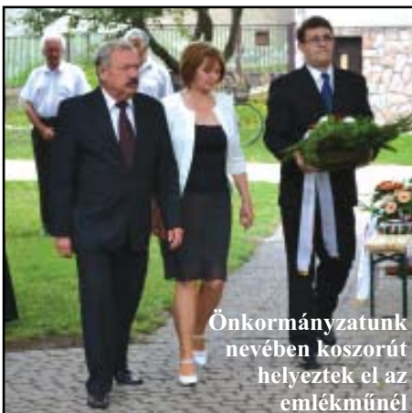
Önkormányzatunk nevében koszorút helyeztek el az emlékműnél