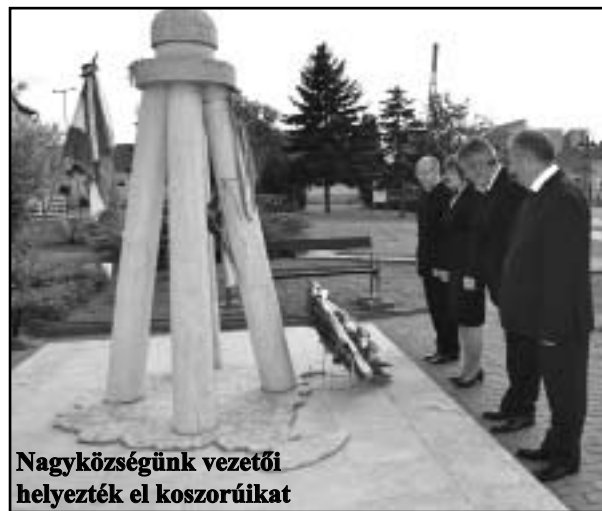
Nagyközségünk vezetői helyezték el koszorúikat

ahhoz, hogy a felőrlődés helyett megújuljunk, megerősödjünk e tapasztalat által, és megtaláljuk a formáját a közös emlékezésnek, az összetartozásnak: a közös ünnepekkel, a közös élményekkel, úgy mint ezen a napon. Ezért emlékezünk minden év június 4-én Trianonra.