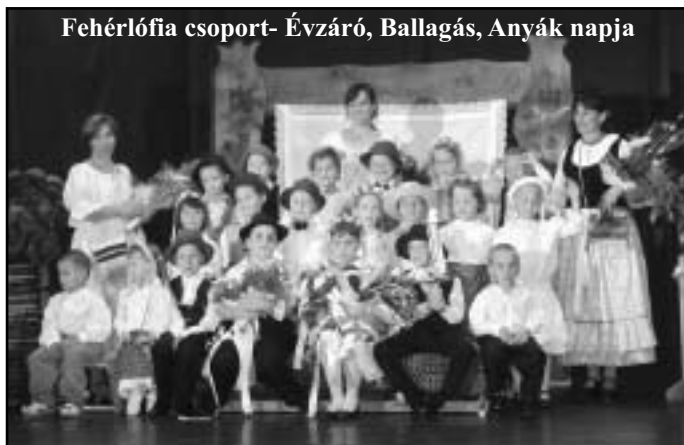
Fehérlófia csoport- Évszázó, Ballagás, Anyák napja