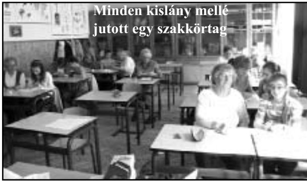
Minden kislány mellé jutott egy szakkörtag