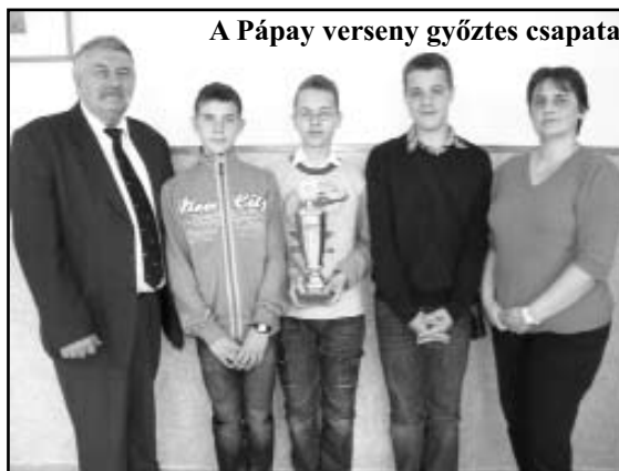
A Pápay verseny győztes csapata

A nyelvészeti vetélkedő témája: nyelvtörténet, leíró nyelvtan, helyesírás, majd a második részében Pápay József életéről és munkásságáról adnak számot a résztvevők. Az első rész feladatai között szerepelt mondatelemzés, tulajdonnevek helyesírása, nyelvhelyességi hibák felismerése, szavak helyes elválasztása. A második részben pedig Mészáros Zsuzsanna tanárnő kérdéseire válaszolva Pápay József életének fontosabb állomásait idézték fel a versenyzők változatos feladatok segítségével: villámkérdések, igaz-hamis állítások, hibás életrajz javítása, újsághír szerkesztése.