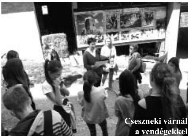
Cseszneki várnál a vendégekkel