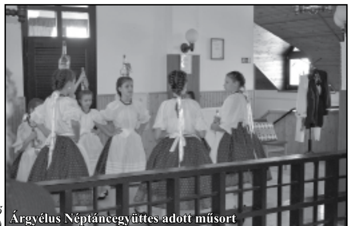
Árgyélus Néptáncgyűttes adott műsort