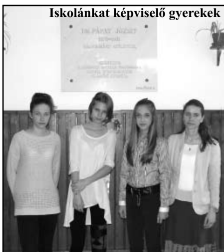
Iskolánkat képviselő gyerekek

Iskolánk 1994-ben vette fel Pápay József nyelvészprofesszor nevét. Ettől az alkalomtól kezdve korábban évenként, majd két évenként a környező iskolák 7-8. osztályos tanulókból álló 3 fős csapatai számára szervezzük meg a Pápay József nyelvészeti emlékversenyt.