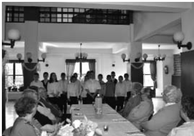
Öszikék Nyugdíjas Klub anyák napi ünnepségén a negyedik osztályos gyerekek