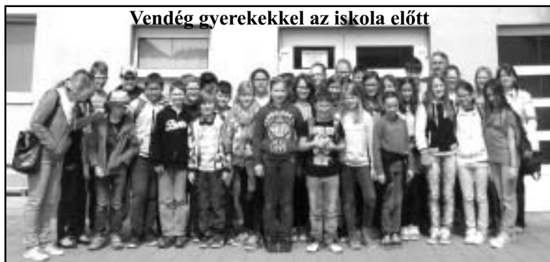
Vendég gyerekekkel az iskola előtt

Viszonozva mindezt, ebben az évben május 7-8-án nálunk járt látogatóban 32 hatodik osztályos hausleiteni diák. A program a korábbi években kialakult „hagyományok” szerint zajlott. Az első nap délelőttjén Nagyigmándi látóival ismerkedtek, felkeresték