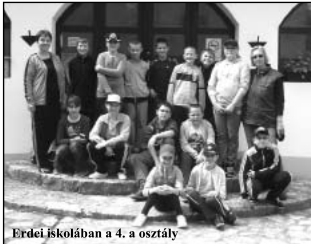
Erdei iskolában a 4. a osztály

Kisvonattal utaztunk a közeli Bakonybélre. Itt megcsodálhattuk a csillagásztörténeti- és úrkutatási