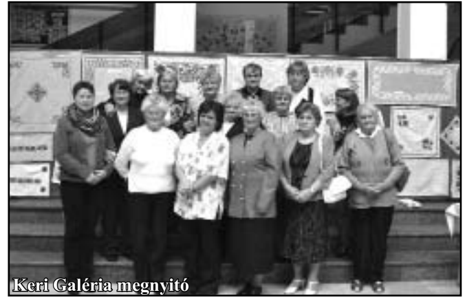
Keri Galéria megnyitó