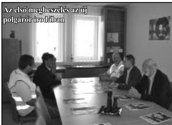
Az első megbeszélés az új polgárőr irodában

utas váró és kiszolgáló helyiségei mellett/ helyet kapott még a 14. éve a településünk lakosainak a megelégedésére működő helyi Polgárőr Egyesület, és a Rendőrség körzeti megbízottja is, melyek egy közös előtérből közelíthetők meg.