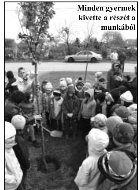
Minden gyermek kivette a részét a munkából

Polgármester asszony köszöntő szavai után el is kezdődhetett a nagy munka. Hiszen azért voltunk ott, hogy minden kisdíák segédkezessen a fáultetésnél. Minden kisgyerek egyenként lapátolhatott egy kis földet, - ki ügyesebben, ki egy kicsit nehezkesebben -, a már előre kiásott jó, mély gödörbe, a fák gyökereihez. Ezentúl bármelyik tanulónk arra jár, vagy ott játszik, büszkén, örömmel pillanthat a két növekvő, egyre terebélyesedő fára, s még inkább magáénak érezheti ezt a szép, új játszótérteret.