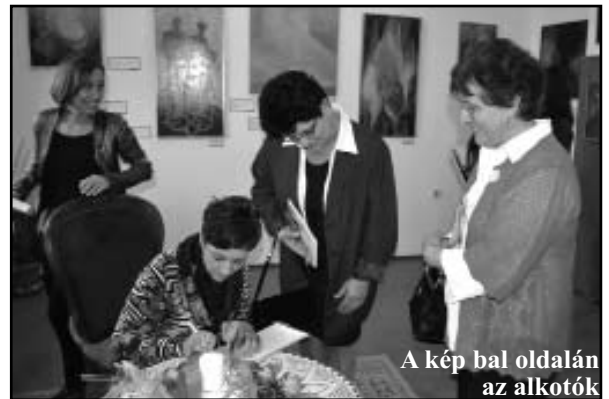
A kép bal oldalán az alkotók