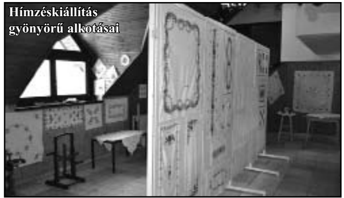
Hímzéskiállítás gyönyörű alkotásai