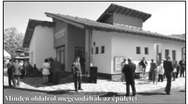
Minden oldalról megcsodálták az épületet

és a polgárőr irodákat. Természetesen ezek az irodák mára már zárva vannak a nagyközönség előtt. Igazán sokan megtisztelték jelenlétükkel önkormányzatunkat és csak csodálni tudták, hogy