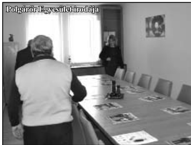
Polgárőr Egyesület irodája