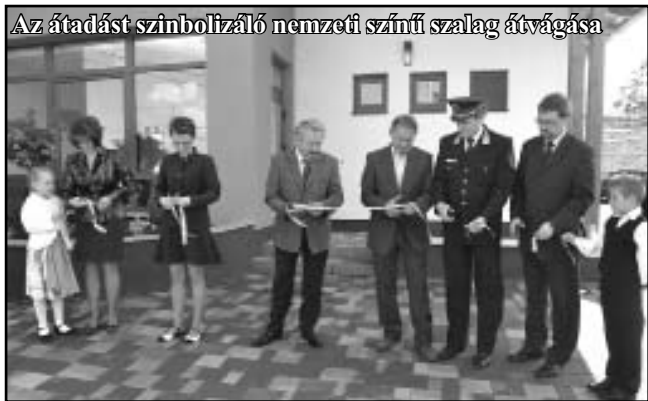
Az átadást szimbolizáló nemzeti színű szalag átvágása