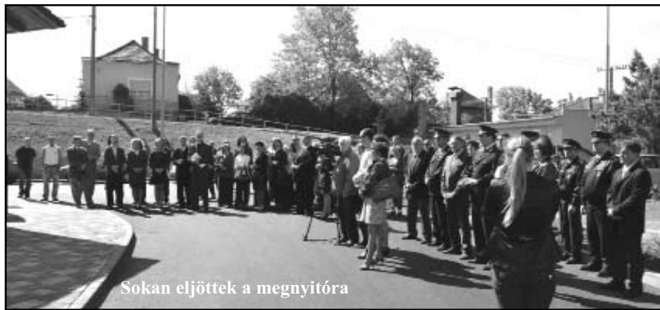
Sokan eljöttek a megnyitóra

Az akkori tervek alapján hármastagolású épület készült, melynek az egyik harmadában gyermek- és felnőtt váróhelyiségek, a másik harmadában egy gépkocsivezetői tartózkodó helyiség, illetve az utazóközönséget kiszolgáló