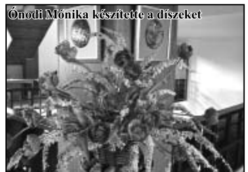
Ónodi Mónika készítette a díszeket