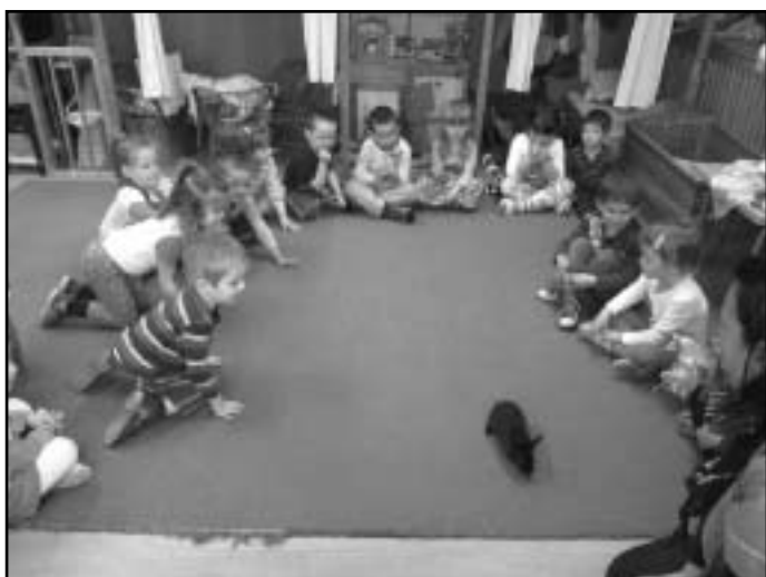
Pillangó csoport és a nyuszi