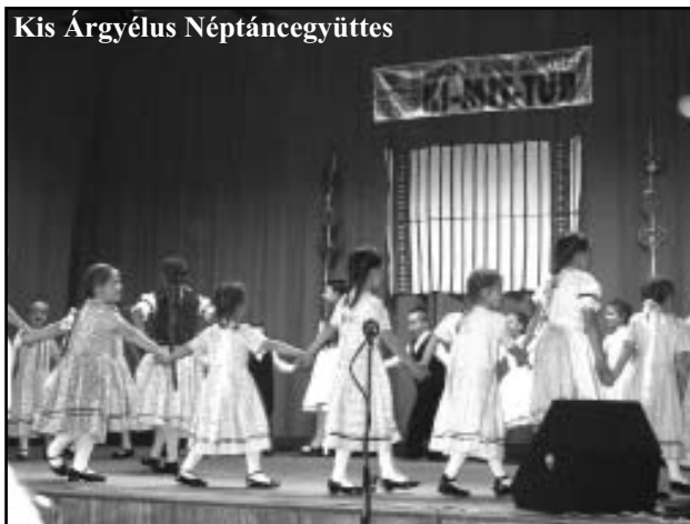
Kis Árgyélus Néptáncgyűttes

A tatabányai Forgórózsa Népművészeti Központ szervezésében 672 fellépő érkezett a 2. Észak-és Közép-Dunántúli Népművészeti KI-MIT-TUD-ra. A nagy létszámra való tekintettel az idén is két helyszínen a Puskin Művelődési Házba és a bánhidai Szlovák Házba várták az érdeklődőket. A KI-MIT-TUD célja, hogy fellendítse az