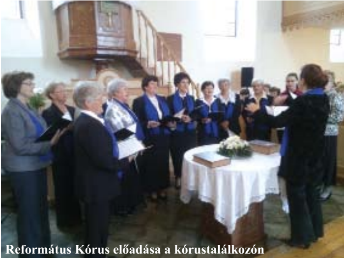
Református Kórus előadása a kórustalálkozón