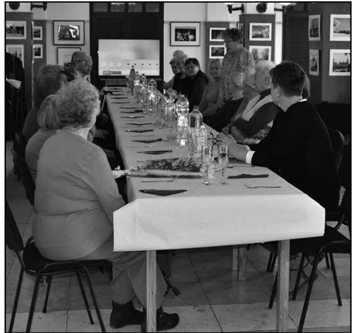
A klub tagjai