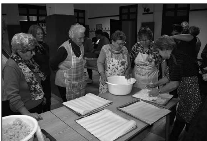
Az Őszikék Nyugdijas Klub tagjai a bajnaiakkal közösen sütöttek