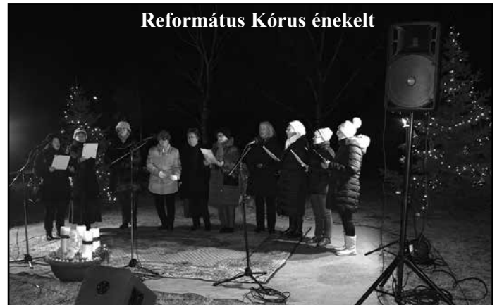
Református Kórus énekelt