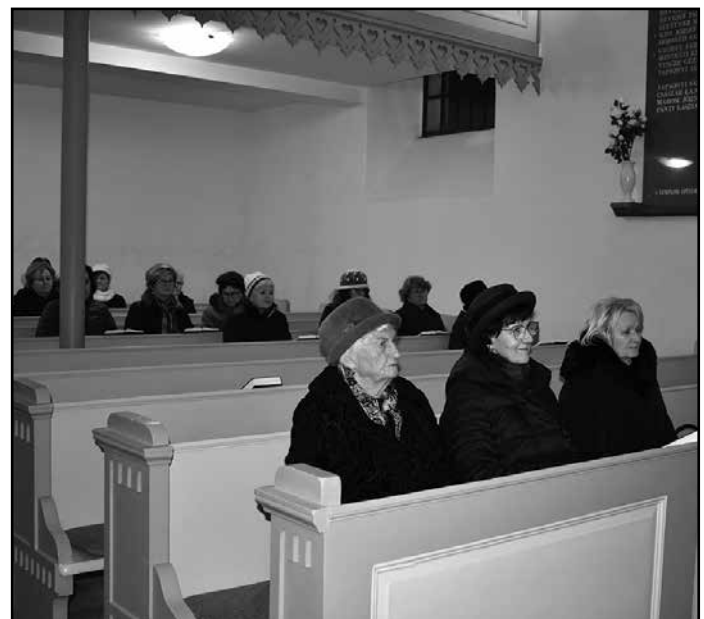
A református Templomban