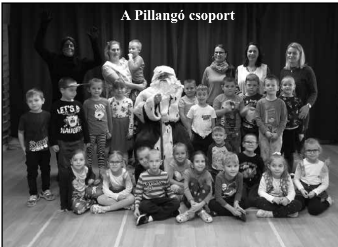
A Pillangó csoport