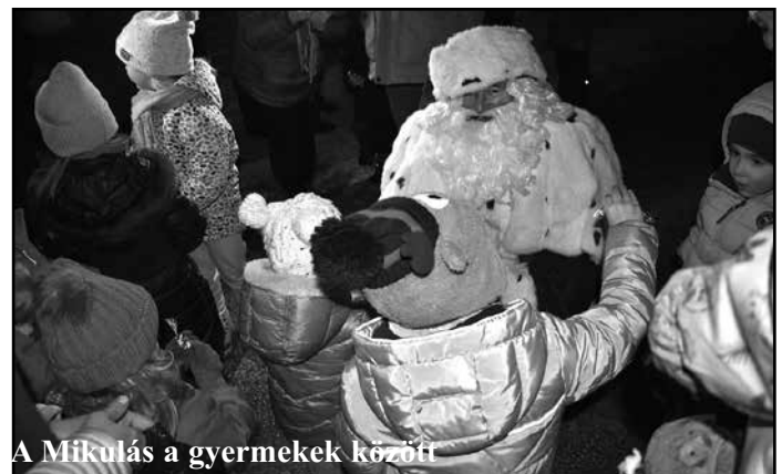
A Mikulás a gyermekek között

István utcai kereszteződéshez várták a gyermekek. A csípős hideg ellenére mindegyik megállóhelynél sok-sok lelkes kisgyerkőc és szülei várták a Mikulást. Az idén is járt a forró tea a Mikulásra várakozóknak, ami nagyon jól jött a hidegben. Szaloncukor is jutott bőven a gyermekeknek, még a krampuszok is megjutalmazták a bátor kicsiket, akik nem féltek tőlük, reméljük jutott minden apróságnak belőle és