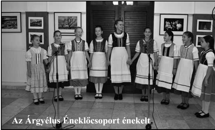
Az Árgyélus Éneklőcsoport énekelt.

készítünk családtagjainknak, barátainknak.