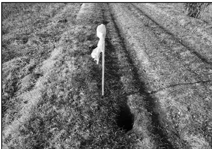
Óvatosan haladjunk az átfolyások közelében