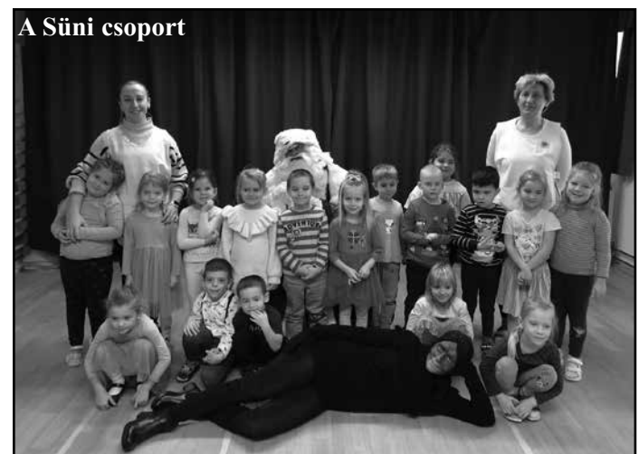
A Süni csoport