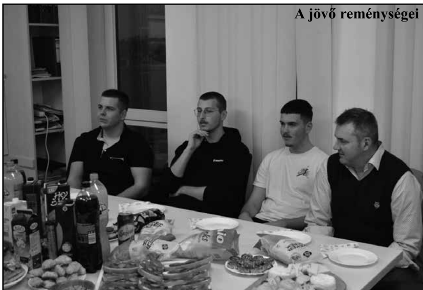
A jövő reménységei

Hisz 2023-ban 8 országos bajnoki aranyat 4 OB ezüstöt 8 Keserűvízes kupát valamint 1 világcsúcsot és egy világcsúcs beállításhoz. A rendezvény folytatásában felkértem