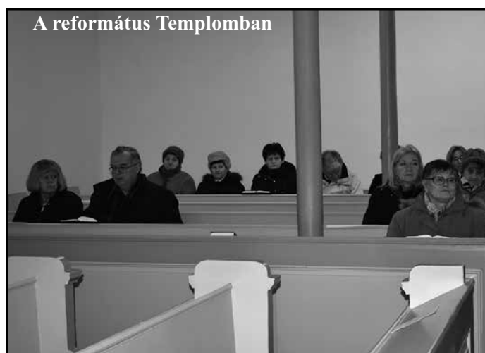
A református Templomban