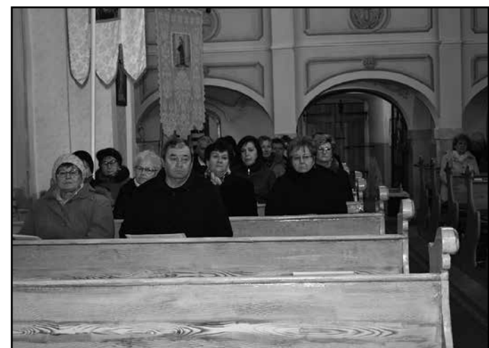
A Szent Mihály Római Katolikus Templomban