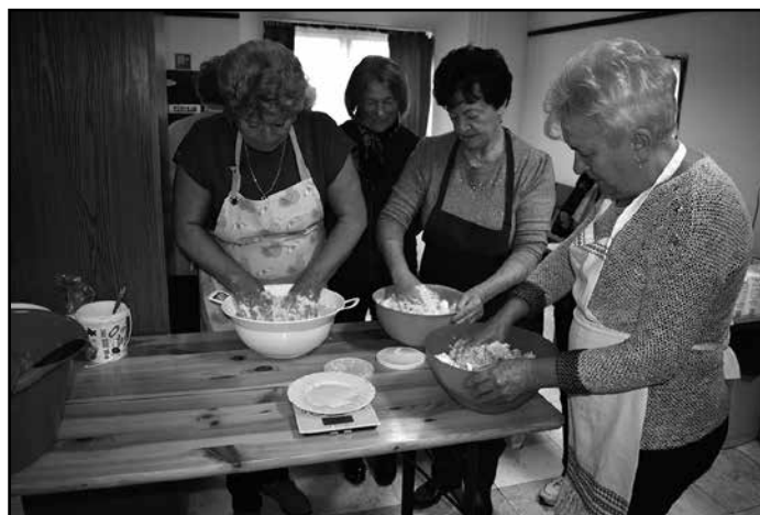
Készül a vakarcs a bajnaiak által