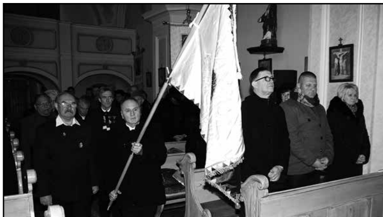
A megemlékezés kezdetekor

területi igényeit Csehszlovákiával szemben. Németország képviselőiben Ribbentrop külügyminiszter, Olaszország részéről Ciáno gróf külügyminiszter hozták meg azt a döntést, miszerint békés úton a magyar királysághoz visszakerül a felvidékből 12 400 km 2 és 1 060 000 magyar lakos....Ez volt az I. Bécsi döntés 1938. november 2-án melyet Teleki gróf vértelen győzelemnek nevezett. Ezt követte Imrédi miniszterelnök budapesti beszéde, mely-