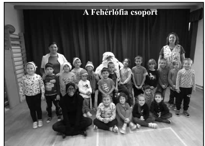
A Fehérlófia csoport