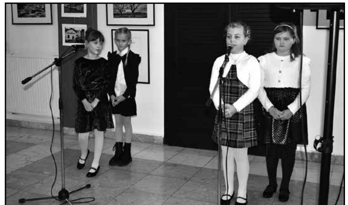
Katolikus hittanos gyermekek adtak műsort