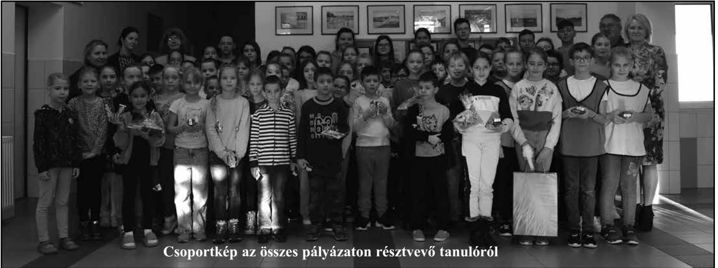
Csoportkép az összes pályázaton résztvevő tanulókról

A többi pályázó sem maradt ajándék nélkül, további 12 tanulónk kapott külön elismerést, valamint 34 fő pedig kisebb ajándékot vehetett át Hajduné Farkas