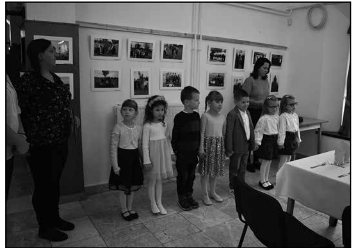
Óvodásaink adtak műsort

A szociális munka napján azokat köszöntjük, akik ezt az őszinte együttérzésen és nagyfokú segítőkészségen alapuló munkát választották hivatásul. Nehéz feladat a szociális munka, nemcsak sokoldalú szakértelmet kíván, de hatalmas áldozatvállalást, emberséget és együttérzést is. A szociális munkásnak nem lehet rossz napja, hiszen tőle mindig segítséget kér-