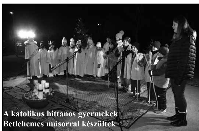
A katolikus hittanos gyermekek Betlehemes műsorral készültek