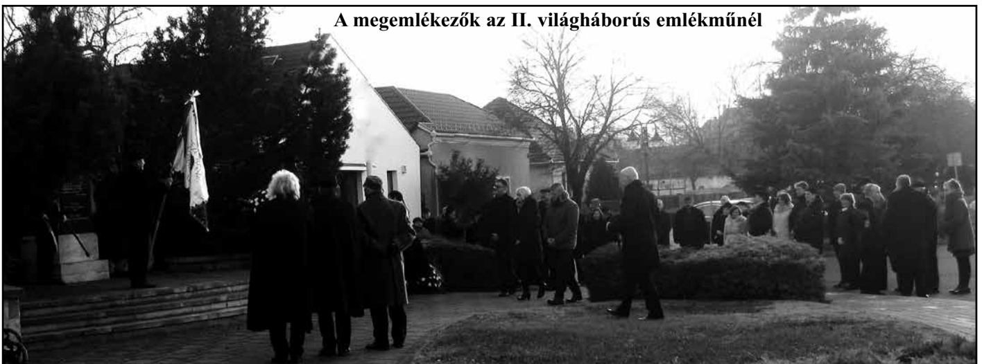
A megemlékezők az II. világháborús emlékműnél

Fikner Piroska Katalin