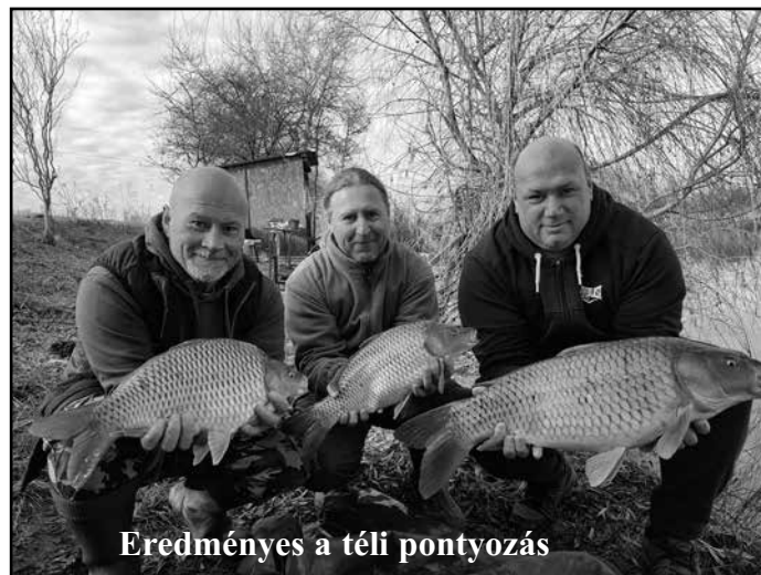
Eredményes a téli pontyozás

2024-ben tervezett közösségi eseményeink: