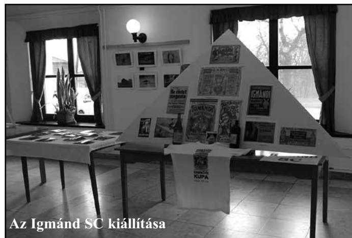
Az Igmánd SC kiállítása