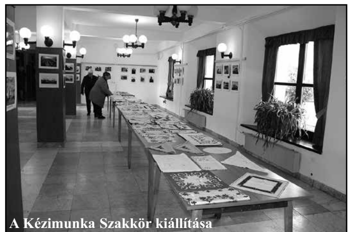
A Kézimunka Szakkör kiállítása