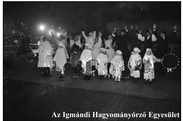
Az Igmándi Hagyományőrző Egyesület

Az adventi vasárnapok alkalmával a közös gyertyagyújtásra vártuk településünk lakóit.. A Hősök téren felállított Betlehem igazán méltó környezetben, gyönyörű karácsonyi fényben pompázik egész advent idején, de a vasárnapok alkalmával tud igazán kiteljesedni. A