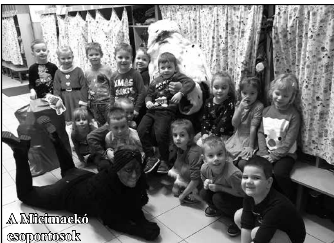
A Mifemackó csoportosok