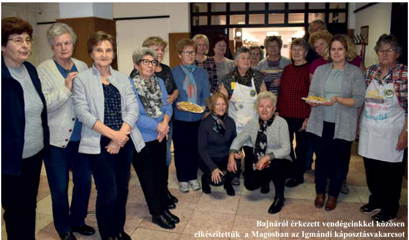
Bajnáról érkezett vendégeinkkel közösen elkészítettük a Magosban az Igmándi káposztásvakarcset