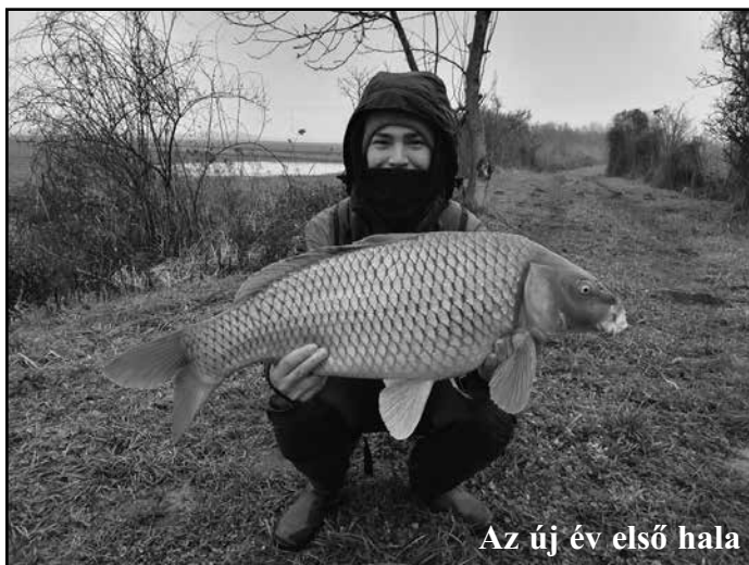
Az új év első hala

Munkájuknak köszönhetően sikerült a rengeteg vizet az árapasztókon keresztül levezetni.