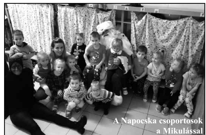
A Naposka csoportosok a Mikulással