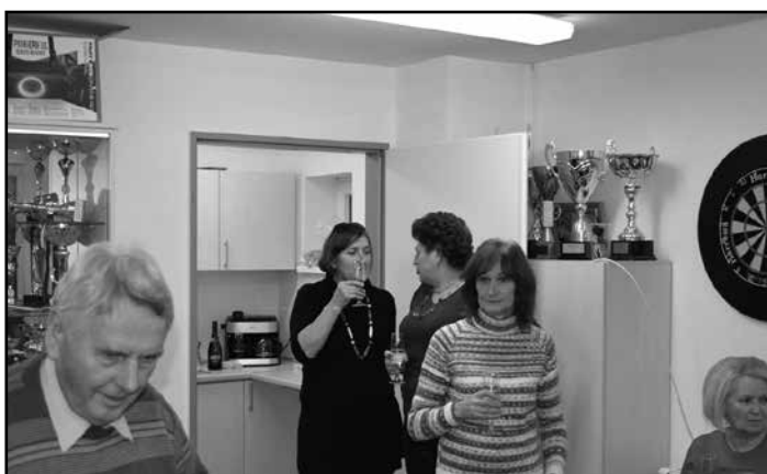
Három a "kislány", akik előteremtették a terülj asztalkámat

Szeretném megköszönni annak 270 főnek illetve családnak akik az éteren keresztül reagáltak és gratuláltak a 60 éves házassági évfordulónk alkalmából.