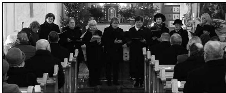
A Nagyigmándi Református Kórus énekel