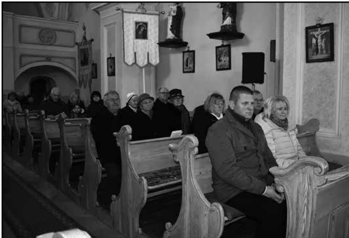
A Szent Mihály Római Katolikus Templomban