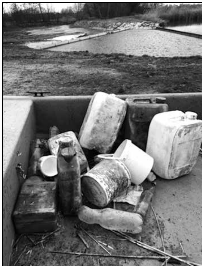
Mindenki maga után takarítson

Kérem, hogy taglistánk, illetve levelezési listánk frissítése, karbantartása céljából, ha valakinek változás történt az e-mail címében vagy mobil számában, küld-