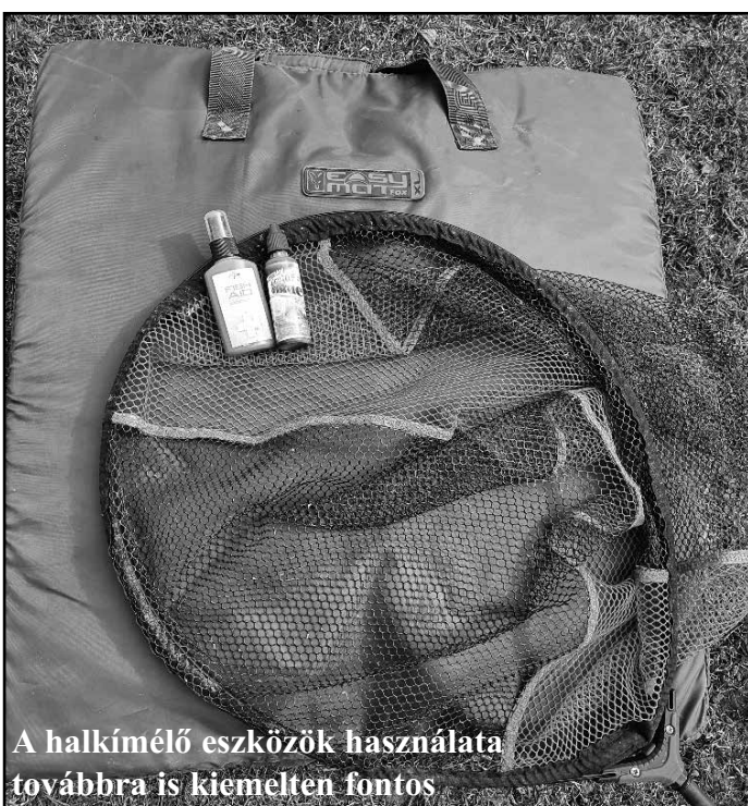
A halkímélő eszközök használata továbbra is kiemelten fontos