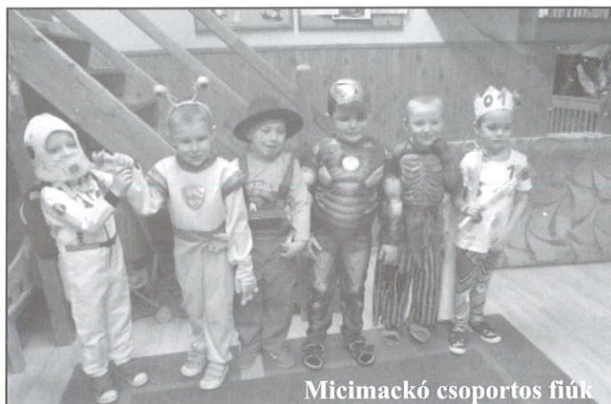
Micimackó csoportos fiúk