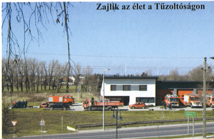
Zajlik az élet a Tűzoltóságon