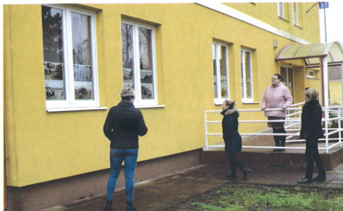
Fotókiállítások tekinthetők meg a Gyermekjóléti Szolgálat nagytermének ablakaiban