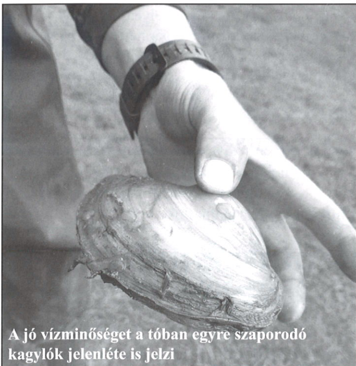
A jó vízminőséget a tóban egyre szaporodó kagylók jelenléte is jelzi