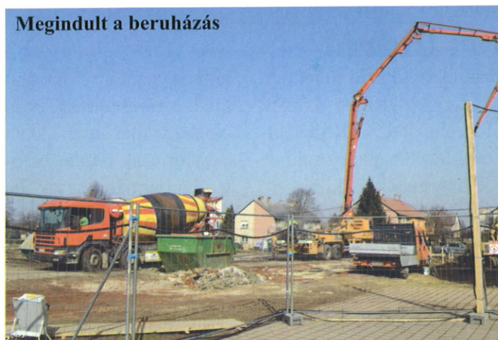
Megindult a beruházás