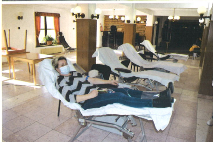
Március 2-án véradás volt a Magosban