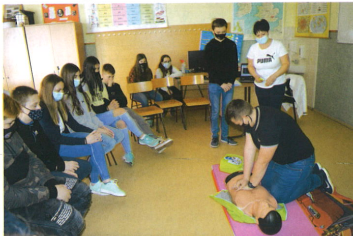
Újraélesztési képzés a Nagyigmándi Pápay József Általános Iskolában