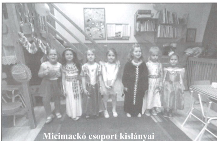
Micimackó csoport kislányai