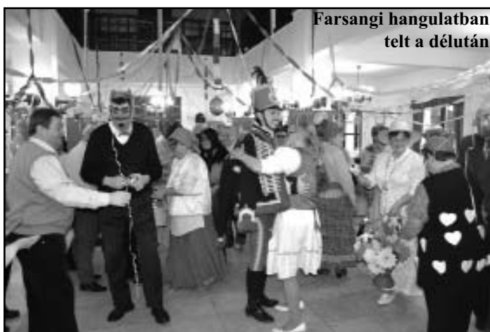
Farsangi hangulatban telt a délután

Az Őszikék Nyugdíjas Klub tagjai február 8-án tartották jelmezes báljukat. A bálra meghívták az etei nyugdíjas klub tagjait egy közös szórakozásra. Voltak jó páran akik jelmezt öltöttek, ezzel emelték a jó hangulatot. Az éjszakába nyúló, vacsorával egybekötött zenés mulatságon mindenki jól érezte magát.