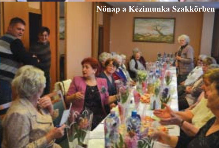
Nőnap a Kézimunka Szakkörben