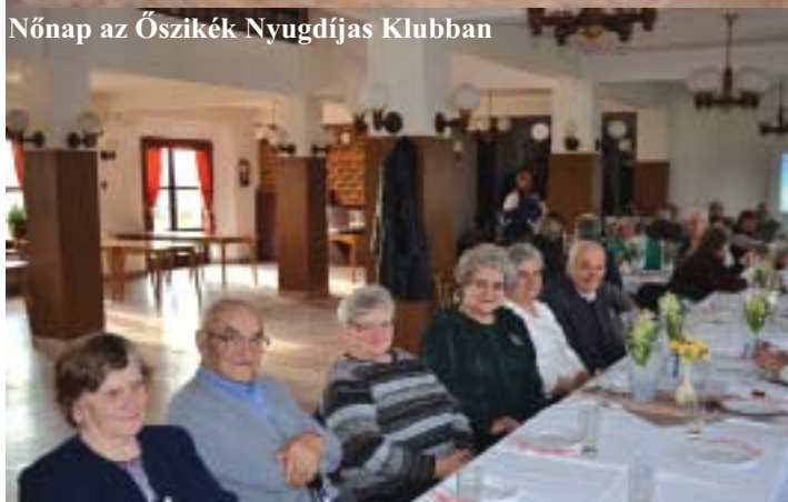
Nőnap az Őszikék Nyugdíjas Klubban