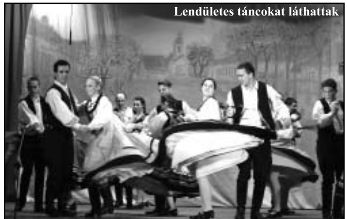
Lendületes táncokat láthattak

Nagy örömeinkre ismét eljöttek naszvadi barátaink hozzánk, akiket minden évben külön örömmel fogadunk. A Naszvadi Csemadok szervezete hagyományőrzői: a Viza és a Sustya citerazenekar, a Búzavirág