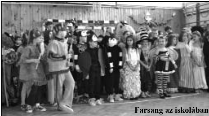
Farsang az iskolában

Farsang időszakában mindig felpezsdül az élet az iskola falain belül: díszítjük a termeket, folyosókat. A farsangi bál napjára a tornaterem is ünneplőbe