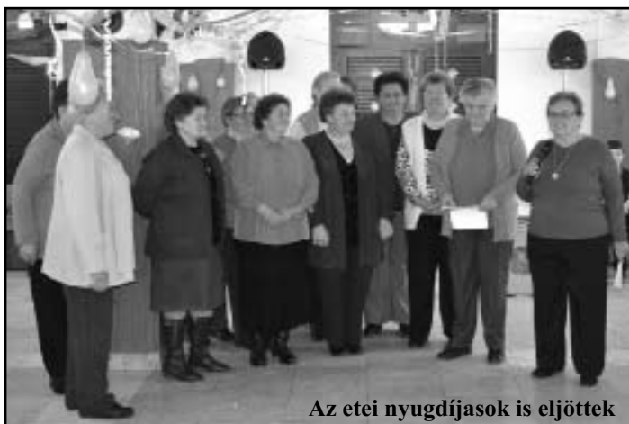
Az etei nyugdíjasok is eljöttek