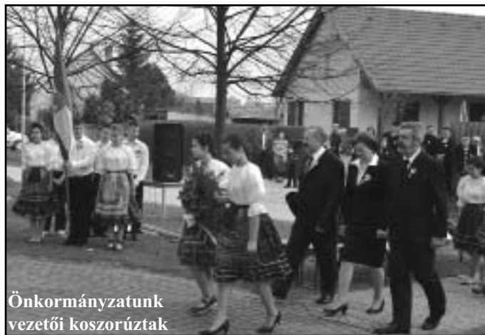
Önkormányzatunk vezetői koszorúztak

Elmondhatjuk tehát, amit olyan ritkán mondhatunk el a magyar történelem – és különösen a XX. századi magyar (Folytatás a következő oldalon)