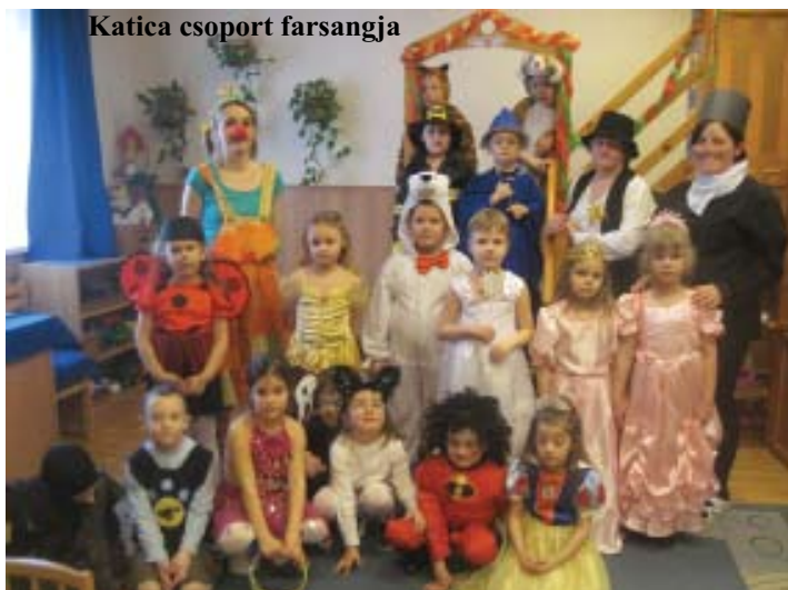
Katica csoport farsangja