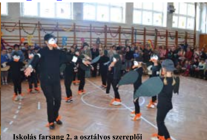
Iskolás farsang 2. a osztályos szereplői