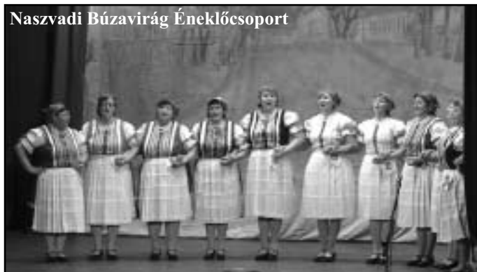
Naszvadi Búzavirág Éneklőcsoport