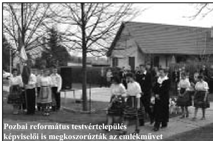
Pozbai református testvértelépülés képviselői megkoszorúzták az emlékművet