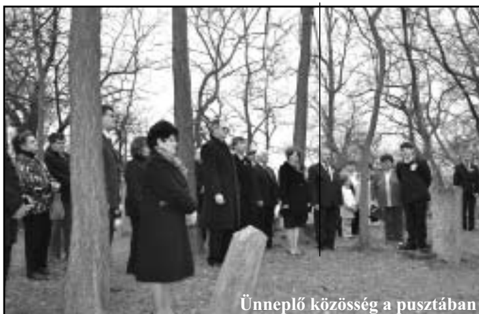
Ünnepelő közösség a pusztában

az ellenfelén, Habsburg Birodalom seregén. Bosszantóan és vérlázítóan megsemmisítő ahhoz képest, hogy a magyar hadsereg korábban önállóan évszázadok óta nem is létezett. Tisztjei a császáriakhoz képest alulképzettek voltak, és a katonáknak a már zajló háborúban alig több mint fél évük volt a felkészülésre.