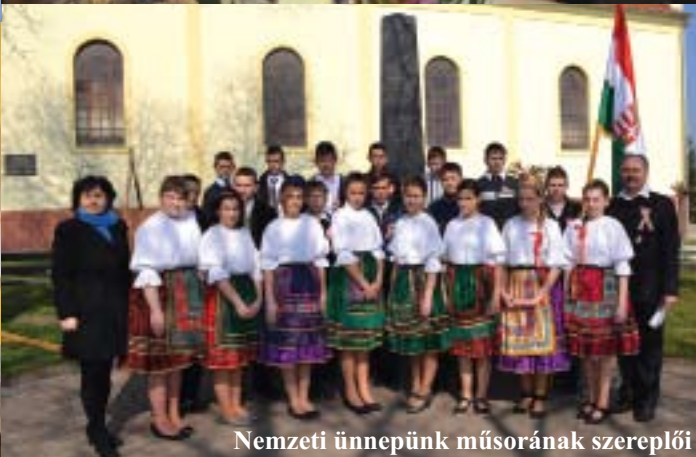
Nemzeti ünnepünk műsorának szereplői

VÉRADÁS április 17-én 14-18 óráig a Magos Művelődési Házban.