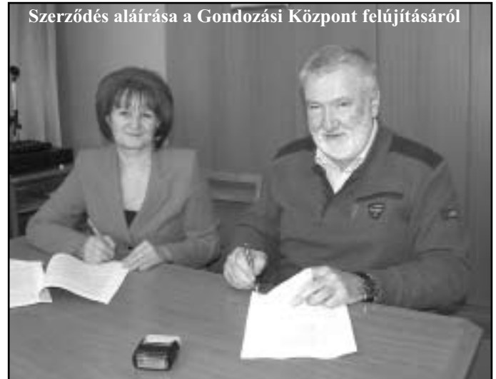
Szerződés aláírása a Gondozási Központ felújításáról

zat nyertesévé a WF Kft. (2900 Komárom, Laktanya köz 9.) ajánlattevőt nyilvánította. Az ellenszolgáltatás összege: 23.850.364,- Ft+ Áfa = azaz bruttó 30.289.962,-Ft. Az épület belső átalakításának kivitelezési munkáit a WF Kft. megkezdte.