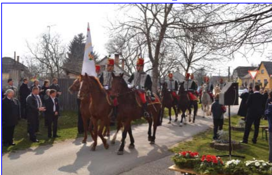
Nagyigmándi Lovaskör huszárbandériumának tagjai felvonultak az ünnepség kezdetén

Március 15-én délelőtt a Vértanúk terén gyűltünk össze ünnepelni a nagyközség fiataljaival, s idősebbjeivel.