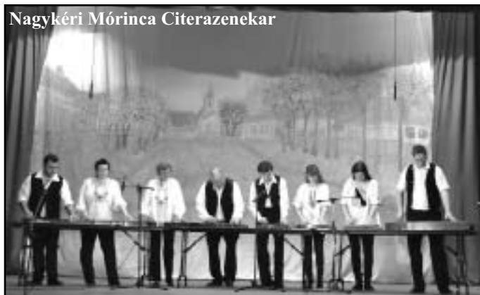
Nagykéri Mórince Citerazenekar

ként. Jöttek Tatáról, Kocsról, Komáromból, és a távolabbi Budajenőről, Szigetközből, de a Felvidékről is. Harmincnégy fellépő csoport, negyvenkettő fellépését nézhették meg a