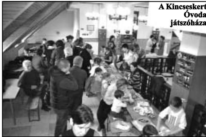
A Kincseskert Óvoda játszóháza