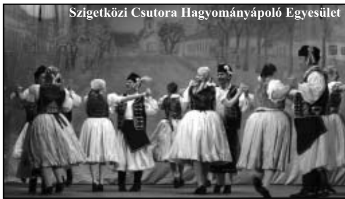
Szigetközi Csutora Hagományápoló Egyesület