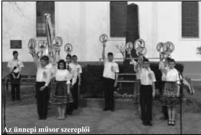
Az ünnepi műsor szereplői

tetteket hajtsanak végre? Vajon mi a magyar elszántság magyarázata?