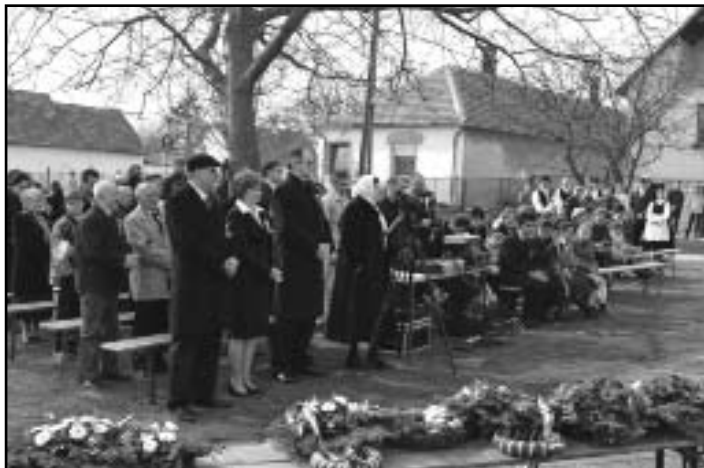
Ünneplő közösség a Vértanúk terén

gyelték-e, de ilyenkor az emlékezéssel együtt különösen érzékenyek vagyunk az igazságra. Nem véletlenül, hiszen az ünnep, az emlékezés lényegéhez tartozik a tisztaság, a megtisztulás. Márpedig a megtisztulás nincs az igazsággal való szembenézés nélkül.