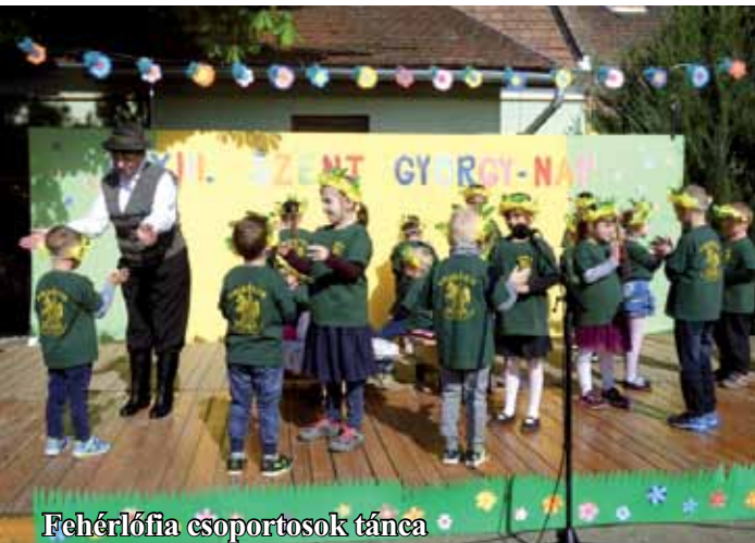
Fehérlófia csoportosok tánca