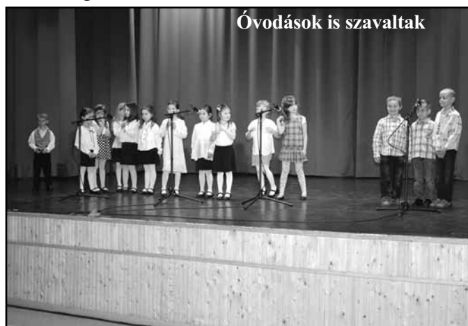
Óvodások is szavaltak