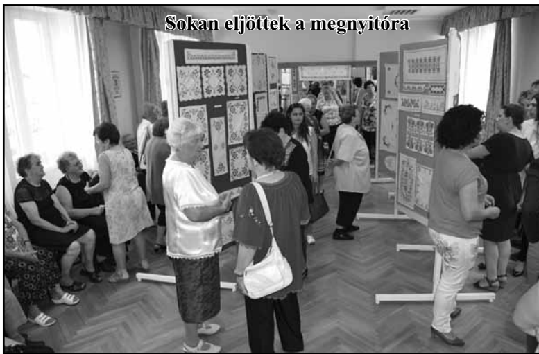
Sokan eljöttek a megnyitóra