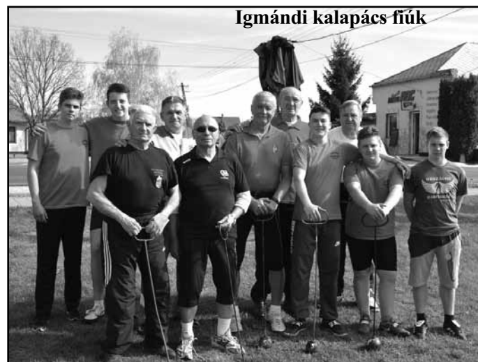
Igmándi kalapács fiúk