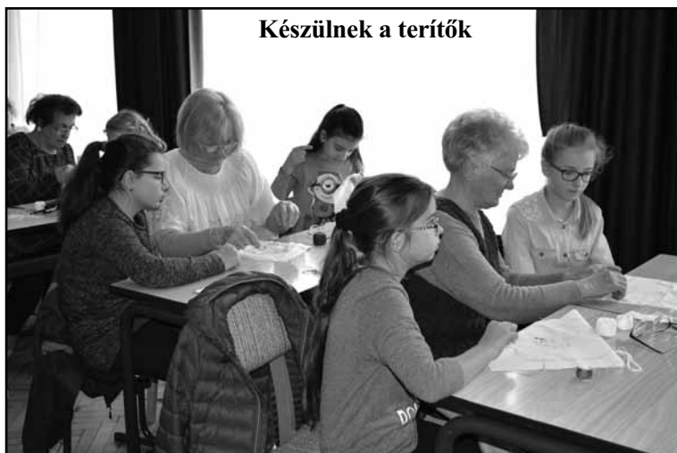
Készülnek a terítők