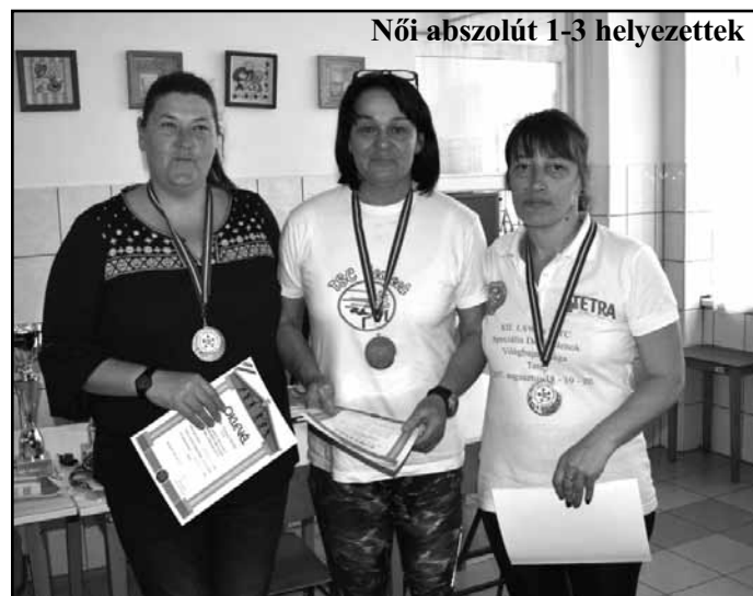
Női abszolút 1-3 helyezettek

A megyei atléták legközelebb április 28-án Tatabányán találkoztak az OB I. fordulóján.