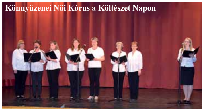
Könnýüzenei Női Kórus a Költészet Napon