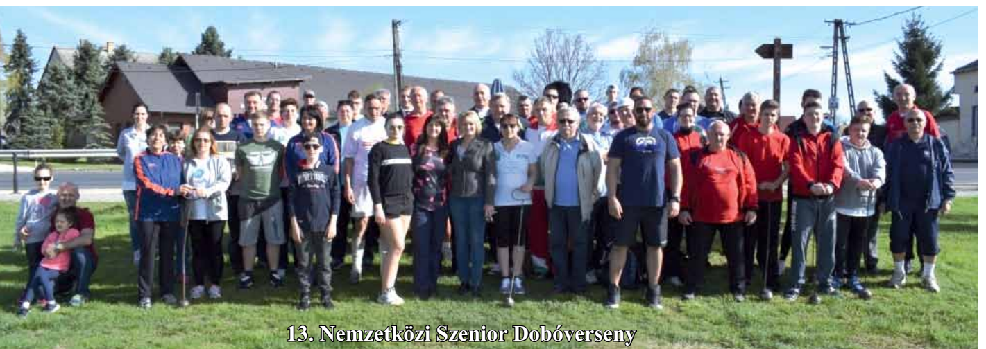
13. Nemzetközi Szenior Dobóverseny