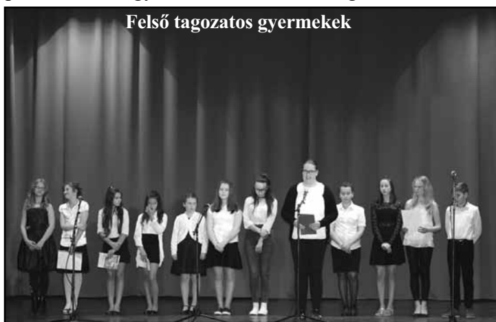
Felső tagozatos gyermekek