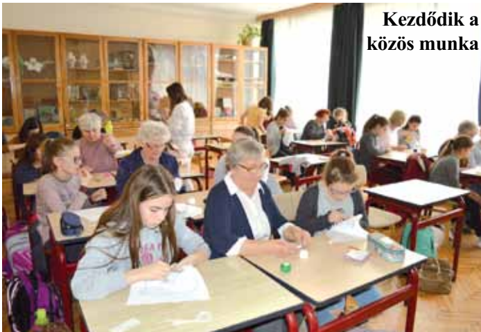
Kezdődik a közös munka