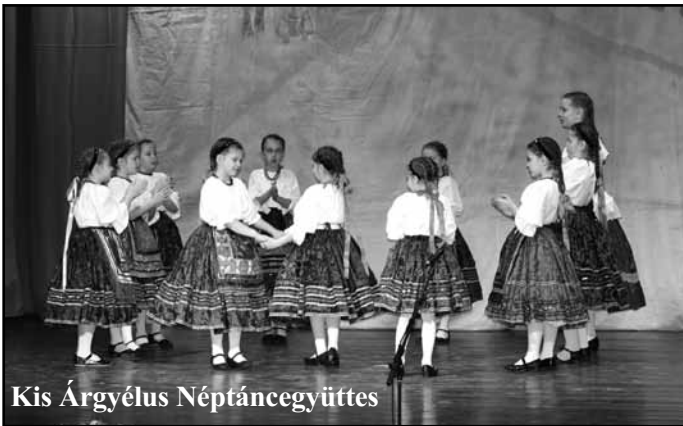
Kis Árgyéus Néptáncgyüttes