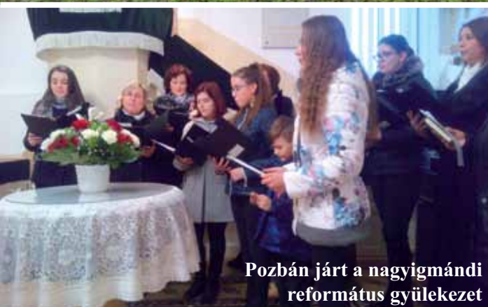
Pozbán járt a nagyigmándi református gyülekezet