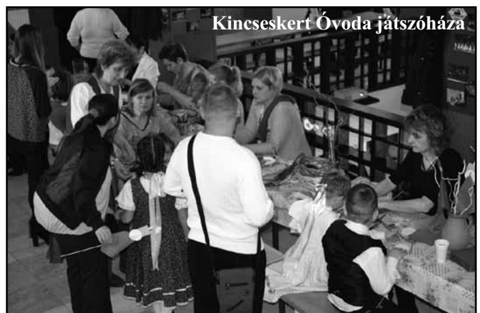
Kincseskert Óvoda játszóháza