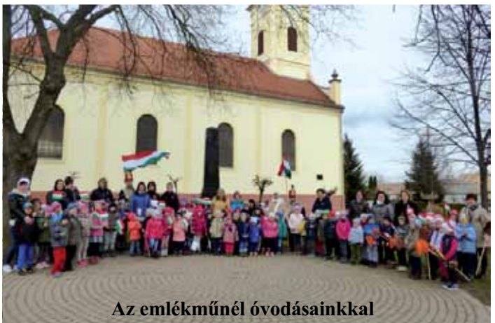
Az emlékműnél óvodásainkkal