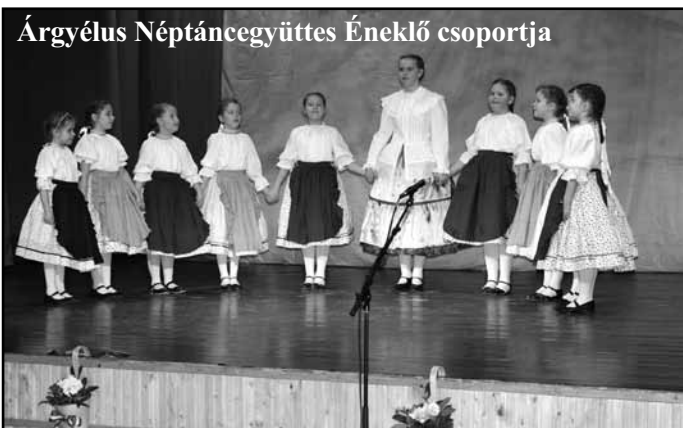
Árgyéus Néptáncgyüttes Éneklő csoportja