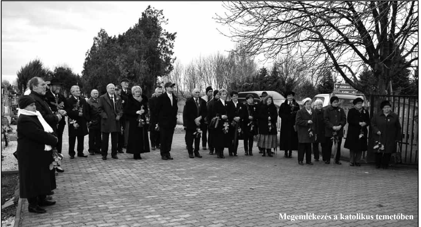
Megemlékezés a katolikus temetőben