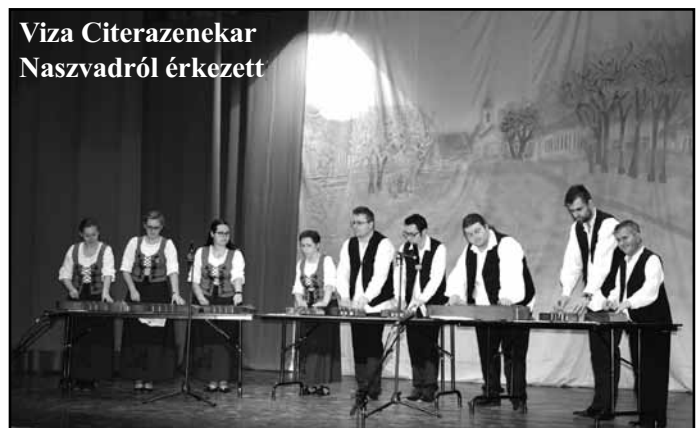
Viza Citerazenekar Naszvadról érkezett

A szervezők ezúton mondanak köszönetet mindazoknak, akik támogatásukkal hozzájárultak ahhoz, hogy egy jó hangulatú fesztivál kerekedjék a Magos Művelődési Házban az idei Mátyás-nap alkalmából: