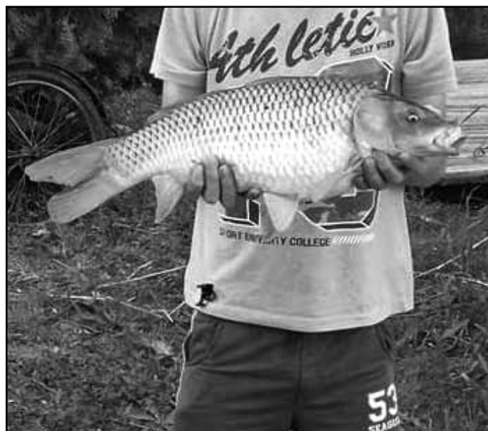
Sárközi Róbert ponty 2,70 kg, második helyezett