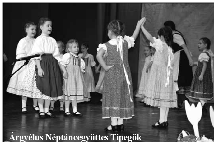
Árgyélus Néptáncgyűttes Tipegők