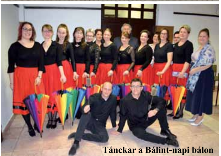
Tánckar a Bálint-napi bálon