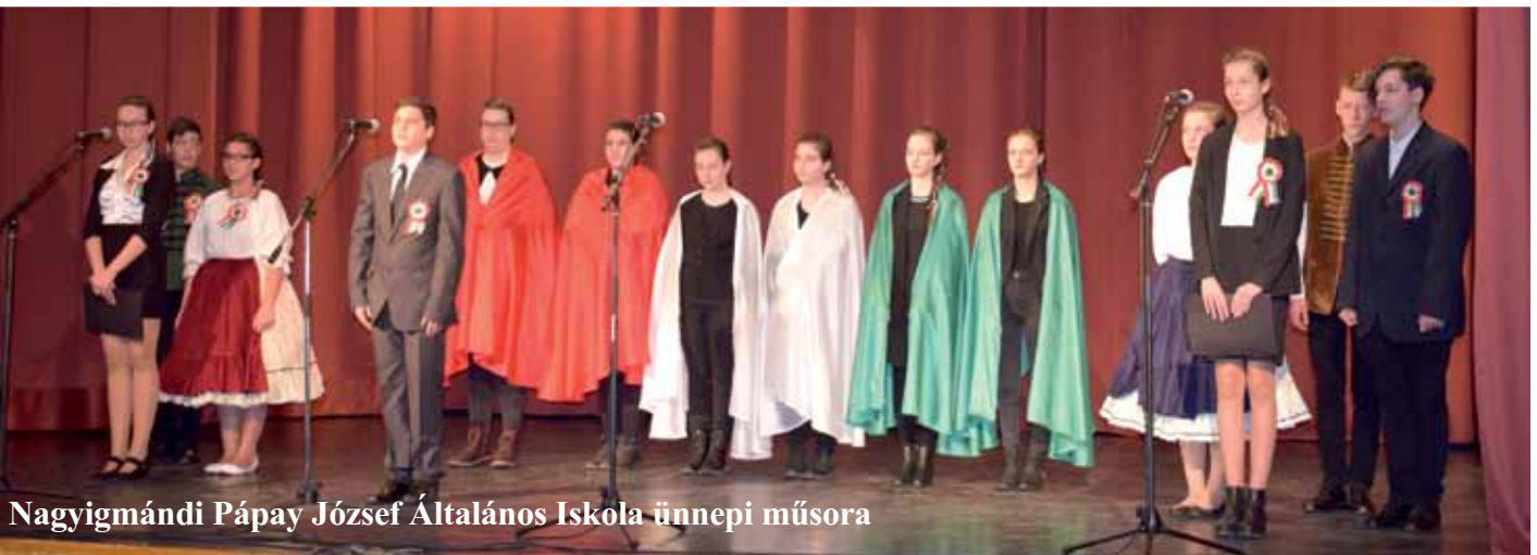
Nagyigmándi Pápay József Általános Iskola ünnepi műsora