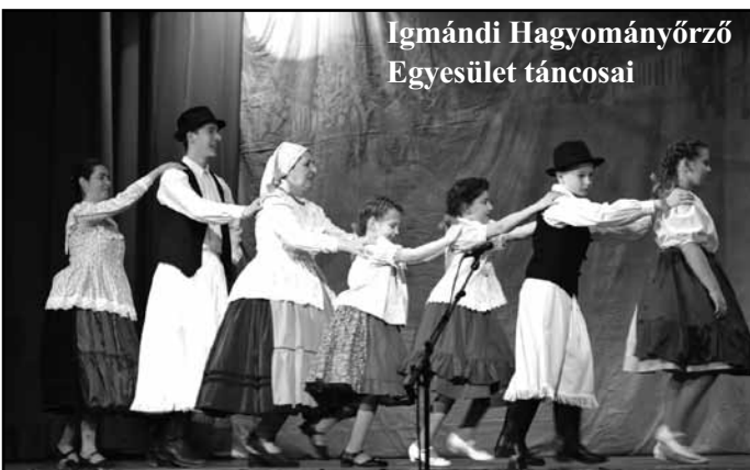
Igmándi Hagyományörző Egyesület táncosai

inknek, az óvodások Somogyi játékfűzést adtak elő. Idén először mutatkozott be a Kis Árgyéus Éneklőcsoport Felvidéki