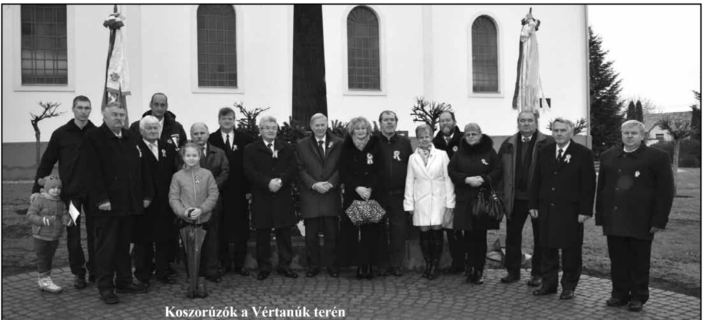
Koszorúzók a Vértanúk terén