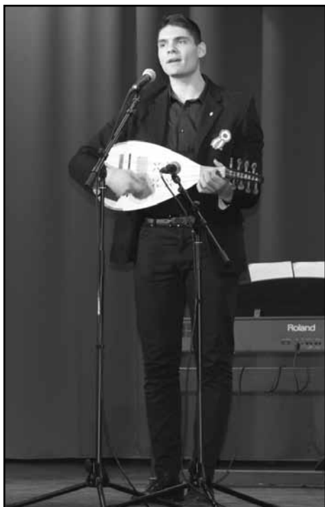
Kiss László Béres Ferenc-díjas énekművész két dallal készült erre az alkalomra