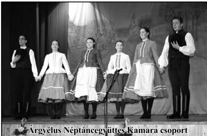
Árgyéus Néptáncgyüttes Kamara csoport