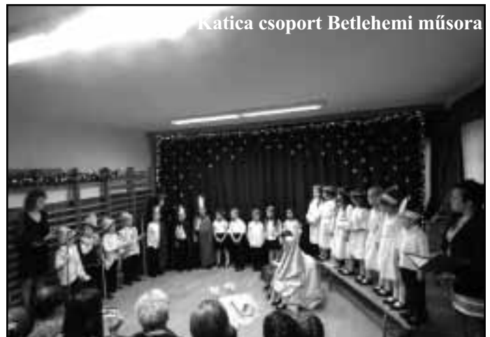
Katica csoport Betlehemi műsora