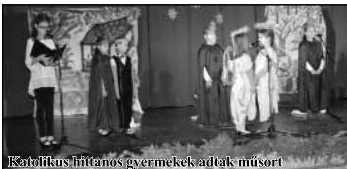
Katolikus hittanos gyermekek adtak műsort