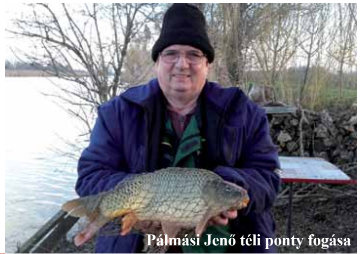
Pálmási Jenő téli ponty fogása