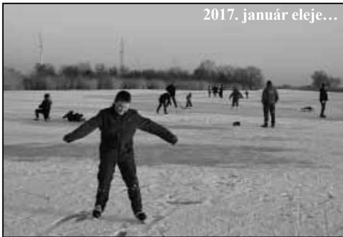
2017. január eleje...

Az Állami Horgászjegy és Fogási napló illetve a Nagyigmándi Horgász Egyesület terület jegye 2018. január 31-ig érvényes, eddig az időpontig lehet még horgászni ezekkel az okmányokkal. Kérjük horgásztársainkat, hogy a helyesen kitöltött Fogási Naplókat február első hetében adják le a