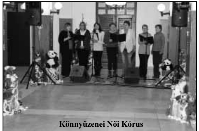
Könnyűzenei Női Kórus