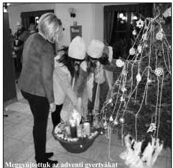
Meggyújtottuk az adventi gyertyákat