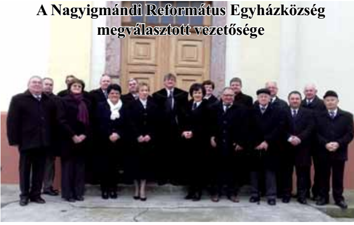
A Nagyigmándi Református Egyházközség megválasztott vezetősége