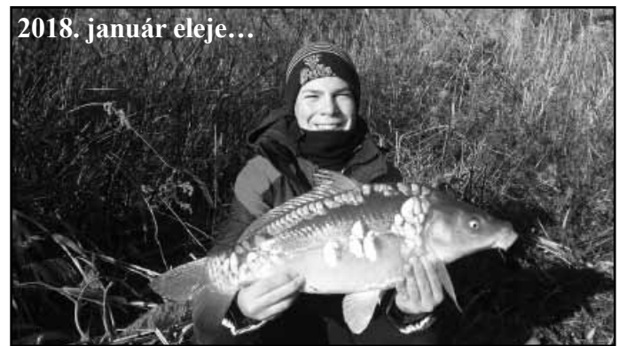
2018. január eleje...

lehet az egyes évszakok éghajlata között. Elég csak a 2017. január hónapjára gondolni, amikor 30 cm-es vastag jégtáblát vágtunk a horgász tavon és kértük a korcsolyázókat, hogy csak a kijelölt helyen csúszkáljanak... 2018. január eleje viszont másképpen alakult, gyakran 8-10 C° hőmérséklet-