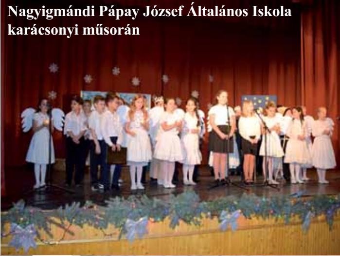
Nagyigmándi Pápay József Általános Iskola karácsonyi műsorán