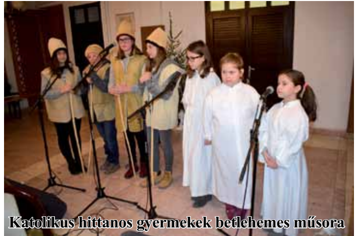
Katolikus hittanos gyermekek betlehemes műsora