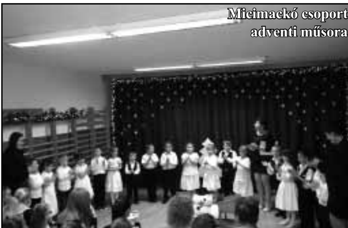
Micimackó csoport adventi műsora