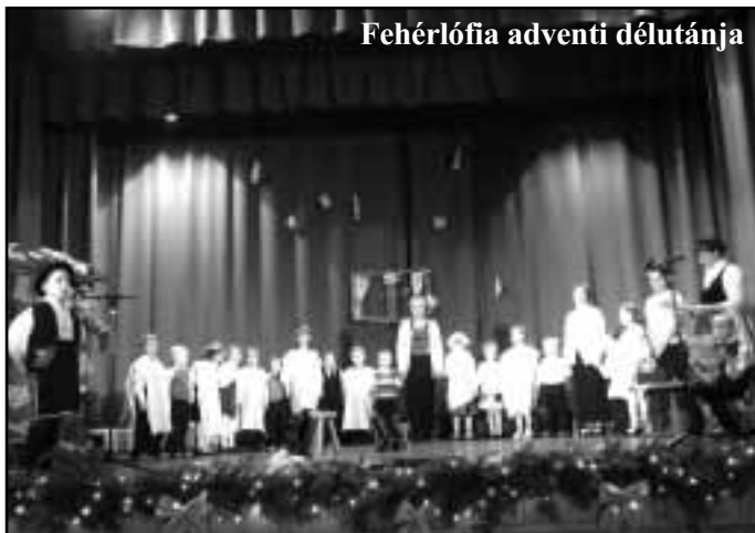
Fehérlófia adventi délutánja