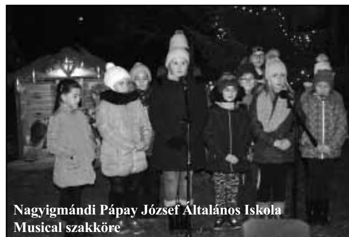
Nagyigmándi Pápay József Általános Iskola Musical szakköre