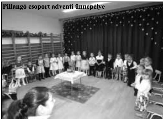
Pillangó csoport adventi ünnepélye