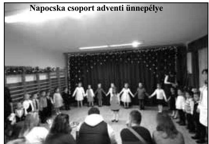
Napocska csoport adventi ünnepélye