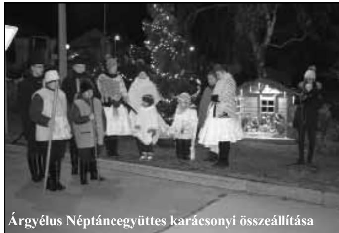
Árgyélus Néptáncgyűttes karácsonyi összeállítása