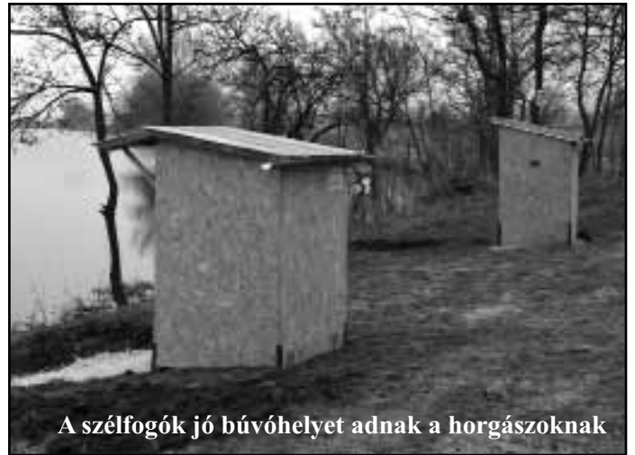
A szélfogók jó búvóhelyet adnak a horgászoknak

öntetűen elfogadta a napirendi pontokban felsorolt előadók beszámolóit. Horgászrendünkben néhány változás történt, az új Horgászrend megtekinthető a Nagyigmándi honlapon, a Nagyigmándi Horgász Egyesület neve alatt, valamint a tóparti hirdető-táblán is. A 2017.évi költ-