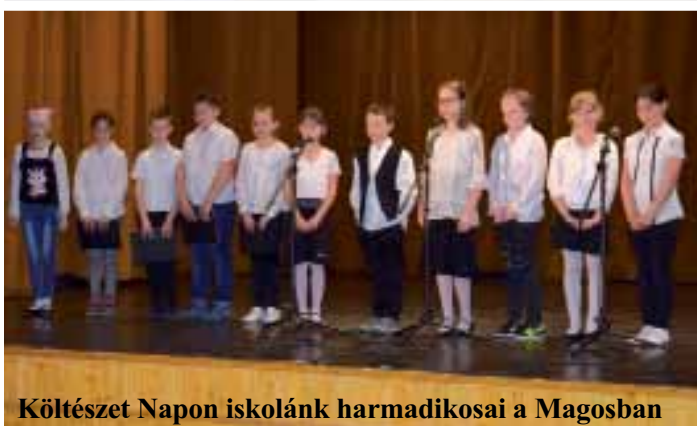
Költészet Napon iskolánk harmadikosai a Magosban