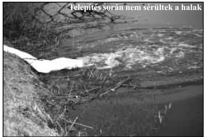
Telepítés során nem sérültek a halak