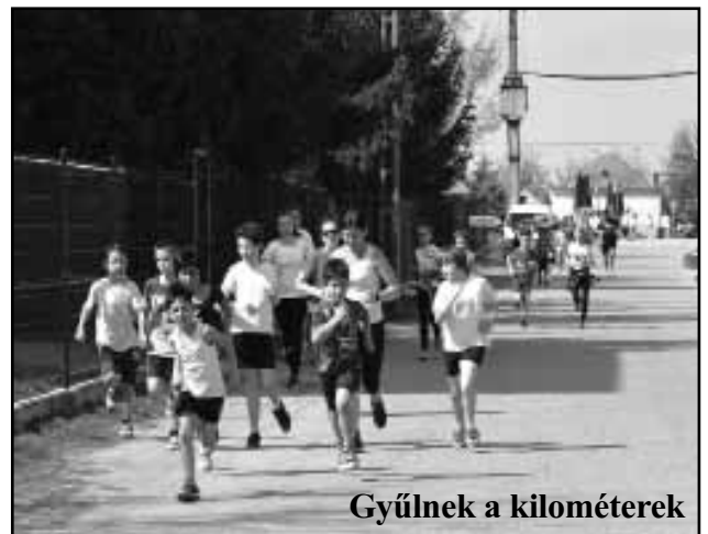
Gyűlnek a kilométerek