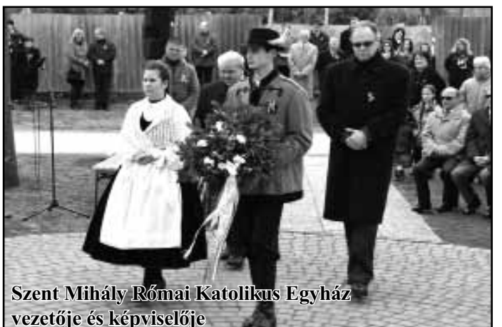
Szent Mihály Római Katolikus Egyház vezetője és képviselője