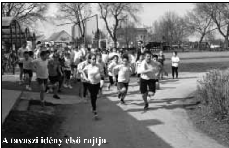
A tavaszi idény első rajtja