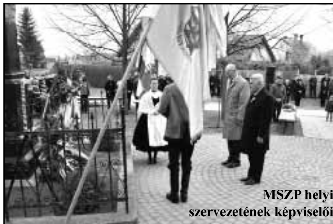
MSZP helyi szervezetének képviselői