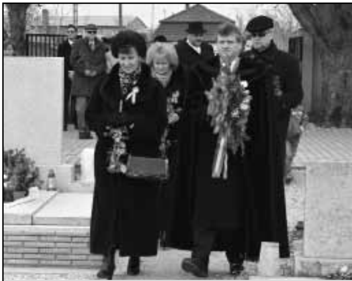
Településünk vezetői a történelmi egyházak vezetőivel közösen koszorúzták meg a mártír lelkészek sírjait

A szabadságharcban részt vettek a nemesség hazafias érzelmű család-