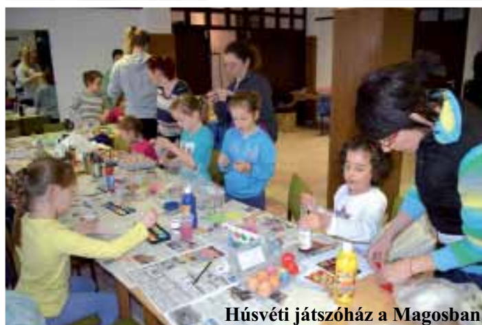
Húsvéti játszóház a Magosban