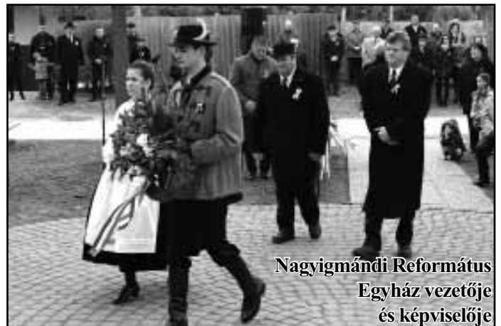
Nagyigmándi Református Egyház vezetője és képviselője