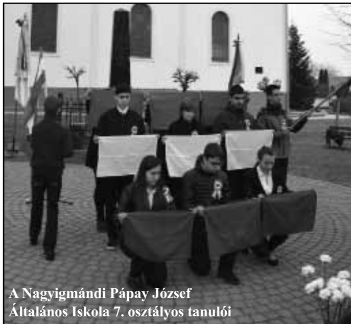
A Nagyigmándi Pápay József Általános Iskola 7. osztályos tanulói