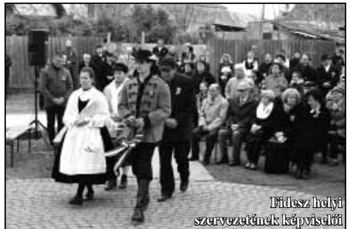
Fidesz helyi szervezetének képviselői