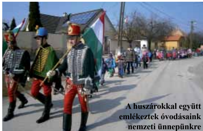
A huszárokkal együtt emlékeztek óvodásaink nemzeti ünnepünkre