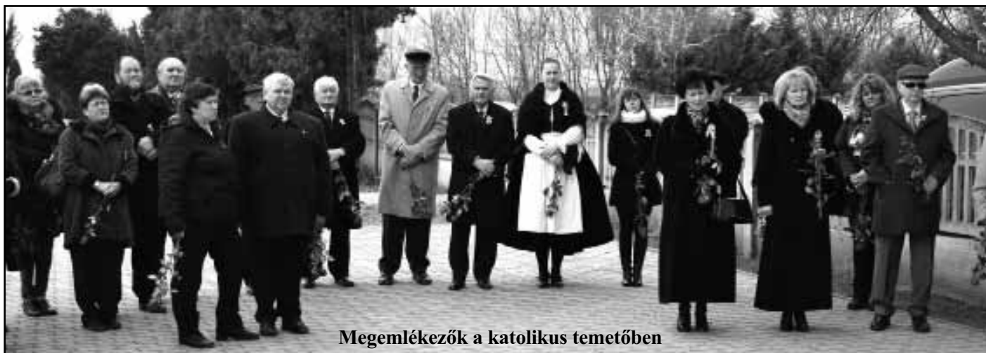
Megemlékezők a katolikus temetőben