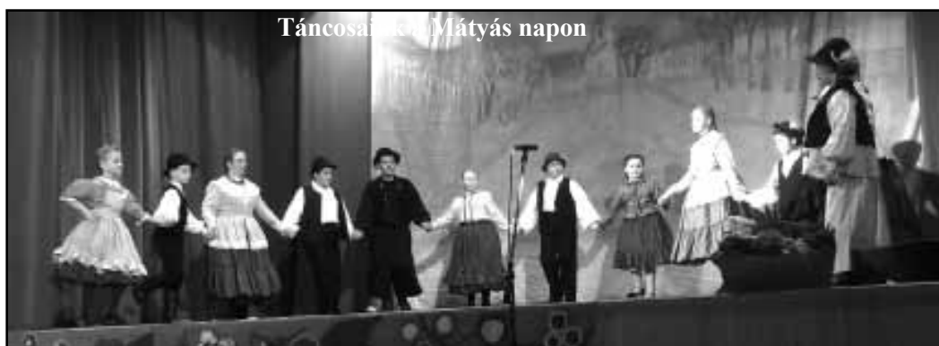
Táncosok a Mátyás napon

vál befejezéseként tartott táncházat, bár a két napos mulatozás végére alaposan elfáradtak.