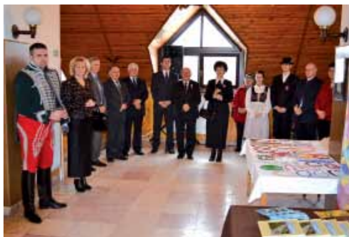
Naszvad község Nyugdíjas Klubja mellett működő szakkör és a Matica Társadalmi Szervezet mellett működő Ügyes Kezek Szakkör kiállításának megnyitója a Magosban