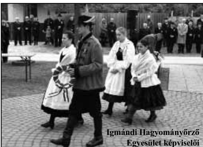
Igmándi Hagyományörző Egyesület képviselői