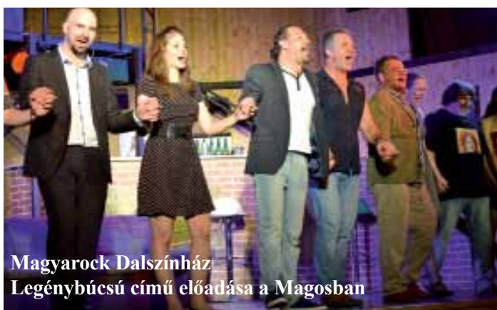
Magyarock Dalszínház Legénybúcsú című előadása a Magosban