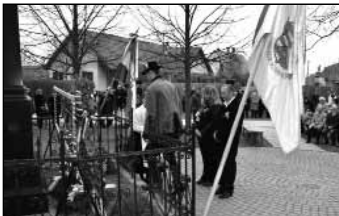
Nagyigmándi Községi Sportkör és a Nagyigmándi Tűzoltóság képviselői