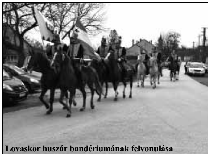
Lovaskör huszár bandériumának felvonulása

Ma született a magyar szabadság, mert ma esett