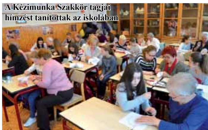
A Kézimunka Szakkör tagjai hímzést tanítottak az iskolában