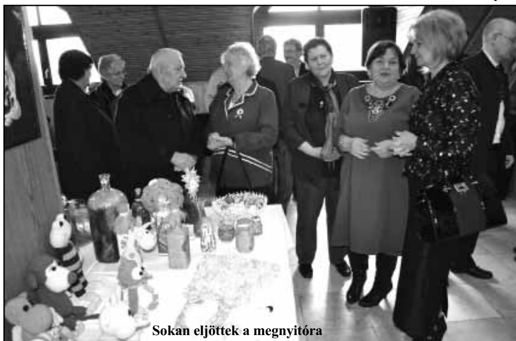
Sokan eljöttek a megnyitóra