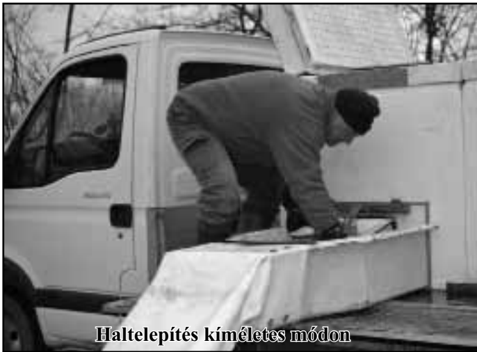
Haltelepítés kíméletes módon