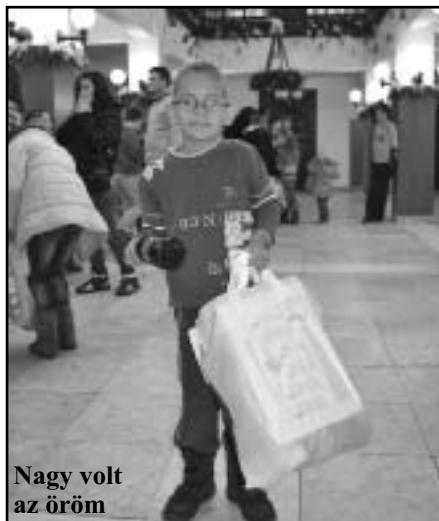
Nagy volt az öröm

A felemelő pillanatokot követően a művelődési ház földszintjén megterített asztalok mellé hívtuk a megjelenteket, ahol a finom falatok elfogyasztása mellett jó hangulatú beszélgetések alakultak ki a résztvevők között. Köszönjük a háttér munkálatokban nyújtott segítségüket a Magos Műve-