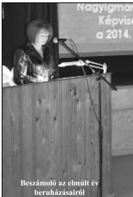
Beszámoló az elmúlt év beruházásairól