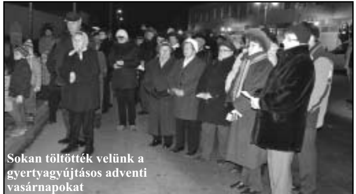
Sokan töltötték velünk a gyertyagyújtásos adventi vasárnapokat

Nagyközségünk önkormányzata ezúton is köszönetet mond minden dolgozójának, a helyi intézmények munkatársainak, a civil szerveződések képviselőinek, hogy munká-