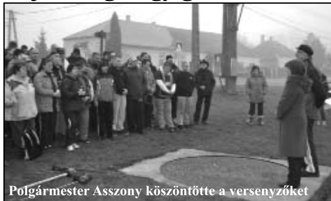
Polgármester Asszony köszöntötte a versenyzőket