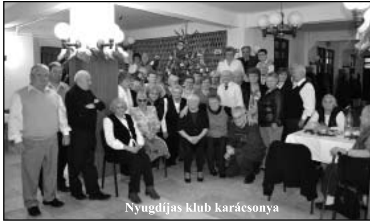
Nyugdíjas klub karácsonya

Júniusban egy természetgyógyászati előadás keretén belül megismerkedhettünk a Ganoderma gomba gyógyító hatásával. Ugyancsak júniusban a Kincseskert Óvoda jubileumi ünnepségén, gyermekeink óvodai életéről készült fénykép kiállítást és videó felvételeket látva emlékezhettünk vissza fiatalabb korunkra.