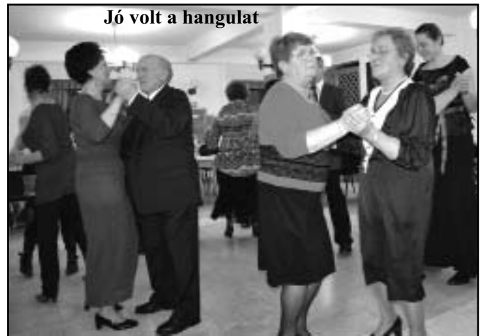
Jó volt a hangulat

Január utolsó szombatján immár 5. alkalommal került megrendezésre a Református Bál a Magos Művelődési Házban.