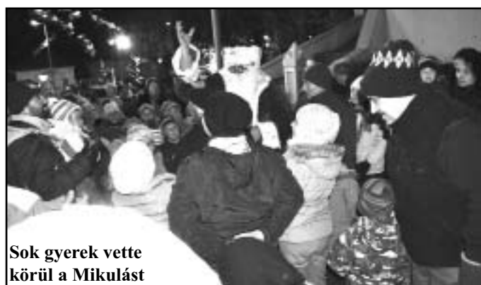
Sok gyerek vette körül a Mikulást

A Pápay és Dobi utcai kereszteszódésben volt az első találkahely, majd a Hősök terén a bolthoz érkezett a hintó, azután is Millenniumi kopjafához várták Őt a gyerekek, végül pedig a vasútállomás mellett is megállt a Téliapó. A csípős hideg ellenére mindegyik megállóhelynél sok-sok lelkes kisgyerkőc várta a Mikulást. A bátrabbak még verssel és dallal is készültek a nagy találkozás tiszteletére. A szavalatokért és az énekszóért idén is járt a finomság, még a kram-