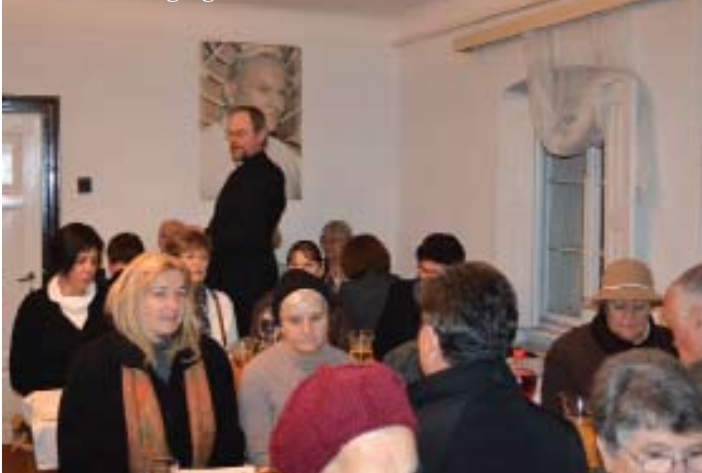
Szeretetvendégség a Parókián