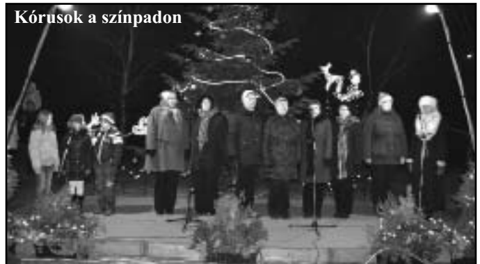
Kórusok a színpadon