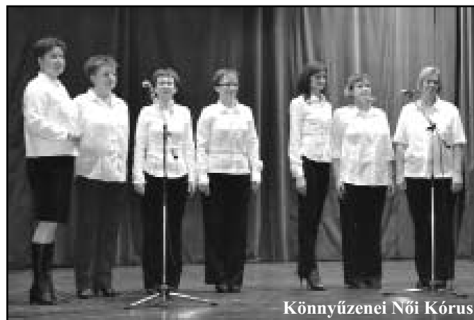
Könyvzenei Női Kórus