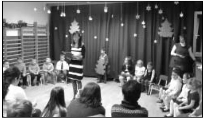
Napocska csoportosok Adventi ünnepélye

„Lelkünkben gyűjts pici gyertyát Csengess éjjünkön át, s csillantsd elének törékeny játékunkat, a reményt.” - Babits Mihály gondolataival vette kezdetét december 12.-én a Micimac- kó csoport adventi ünnepege.