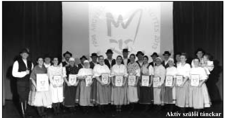
Aktív szülői tánckar

A tudósítás utolsó fele szólhatna arról, hogy a műsorban gyermekeink a sokszínű magyar kultúra hányféle tájegységének táncát, énekét, viseletét mutatták be, végül felkerülhetne pár fotó a gáláról és kész is a szokásos tudósítás.