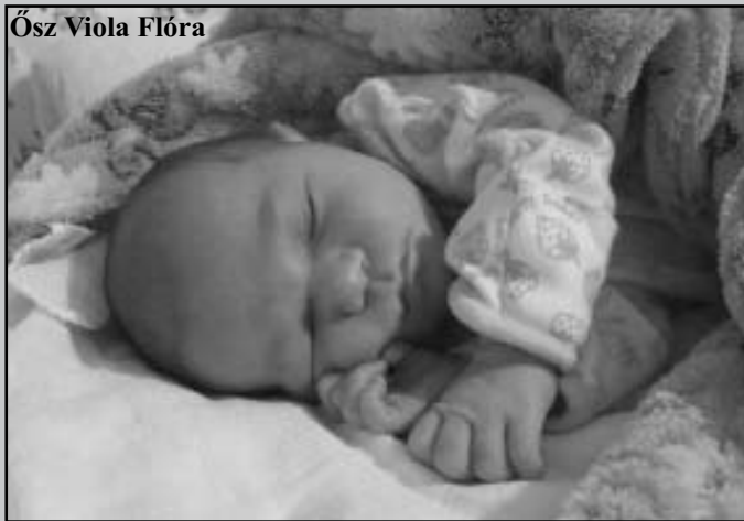
Ósz Viola Flóra

Szeretettel gratulálunk a kedves szülőknek, nagyszülőknek, rokonoknak. Kívánjuk, hogy a kis újszülöttek erőben, egészségben, szeretetben növekedjenek.