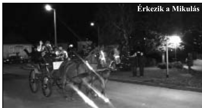
Érkezik a Mikulás

be a falut lovashintóján, lelkes krampuszokkal az oldalán, meg-megállva a már hagyományos csomópontokon.