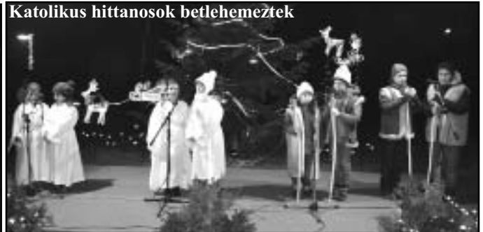
Katolikus hittanosok betlehemeztek

jukkal, részvételükkel hozzájárultak a rendezvény sikeres megvalósításához.