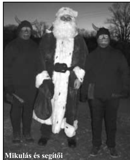
Mikulás és segítői

A Pápay és Dobi utcai kereszteszódésben volt az első találkahely, majd a Hősök terén a bolthoz érkezett a hintó, azután is Millenniumi kopjafához várták Őt a gyerekek, végül pedig a vasútállomás mellett is megállt a Téliapó. A csípős hideg ellenére mindegyik megállóhelynél sok-sok lelkes kisgyerkőc várta a Mikulást. A bátrabbak még verssel és dallal is készültek a nagy találkozás tiszteletére. A szavalatokért és az énekszóért idén is járt a finomság, még a kram-