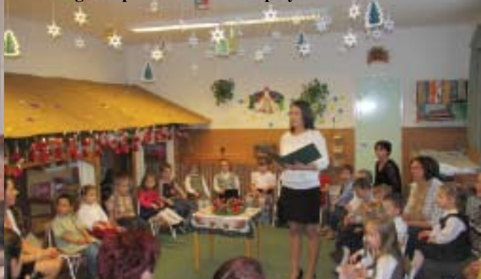
A Pillangó csoport Adventi ünnepélye