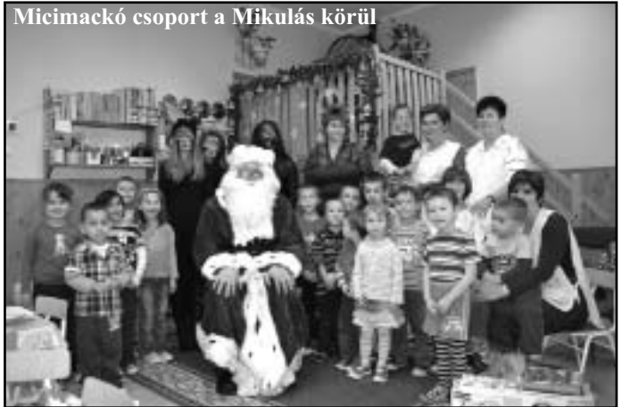
Micimackó csoport a Mikulás körül