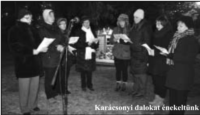
Karácsonyi dalokat énekeltünk