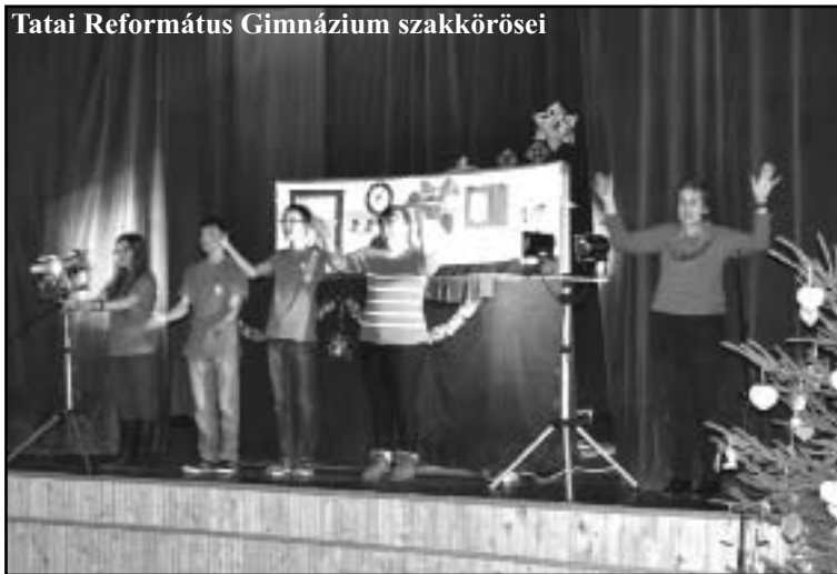
Tatabányai Református Gimnázium szakkörösei

gyakoroltunk. A karácsonyi darab címe „A rosszat jóval győzd meg”. Úgy érzem, igazán büszke lehetek a nagyigmándi hallgatóságra (általános iskola alsó tagozatosok, és a nagycso-