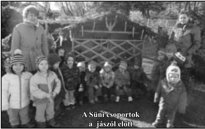
A Süni csoportok a jászól előtt