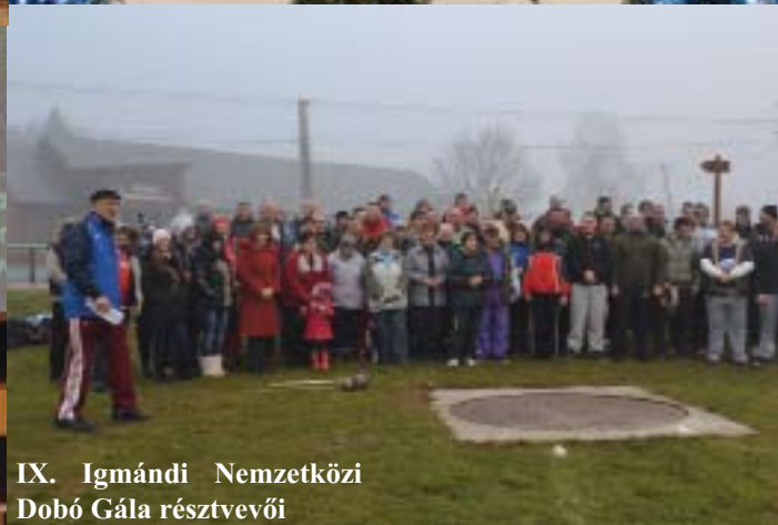
IX. Igmándi Nemzetközi Dobó Gála résztvevői

Bálint napi batyus bál február 15-én 20 órakor a Magosban