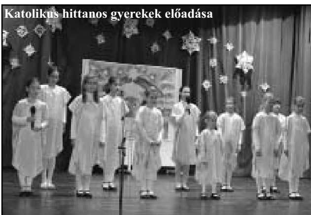
Katolikus hittanos gyerekek előadása

A nehéz gazdasági helyzet ellenére több kft., vállalkozás és helyi magánszemély is nyitott maradt arra, hogy ünnepeink létrejöttét anyagilag, vagy természetben, mindenki a lehetőségeihez mérten jó szívvel támogassa. Felajánlásaik és anyagi támogatásaik eredményeképpen valósulhatott meg ünnepi eseményünk és nagy örömünkre szolgált, hogy a befolyt támogatások lehetővé tették, hogy rengeteg vadonatúj, értékes csodaszép játékot, könyvet, illatszert tudunk vásárolni a gyermekek számára. Megható volt, hogy milyen önzetlen segíteni akárrással fordultak felénk a vállalkozá-