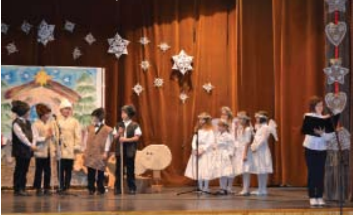
Iskolások karácsonyi műsorán