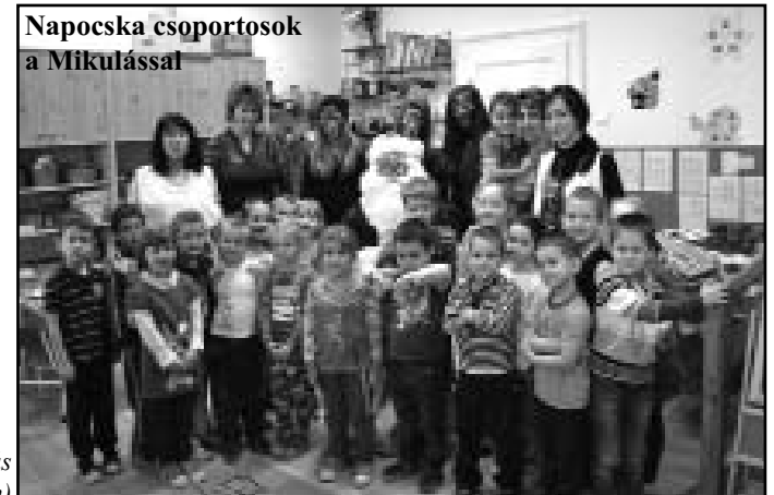
Napocska csoportosok a Mikulással